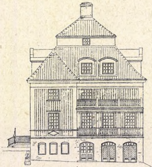
Fasad mot söder.

Undervisningsafdelningen innefattar 2 föreläsningssalar och 1 slöjdsal jämte en rymlig och bekvämt inredd köksafdelning. Dessutom finnes matsal, samlingsrum, föreståndarinnans expeditjonsrum, rum för lärarinnor, för 20 lärarinneelever och 10–12 husmorselever, gästrum m. m.