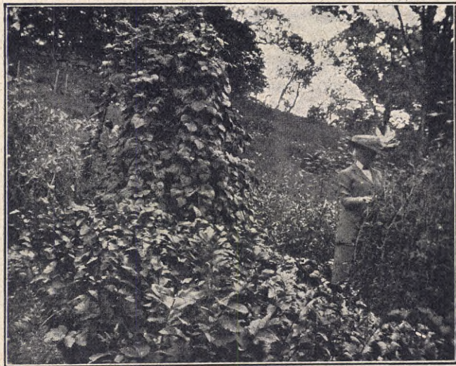
Kvinnlig kolonist i sin täppa efter slutadt kontorsarbete.