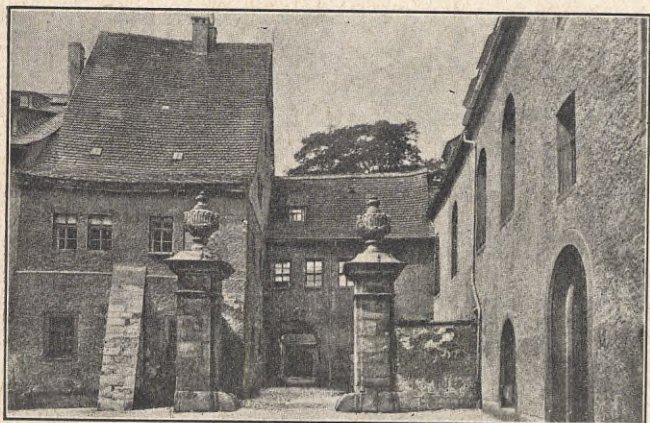
Wittumspalais i Weimar.