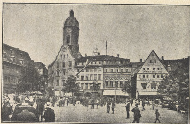
Torget i Jena.