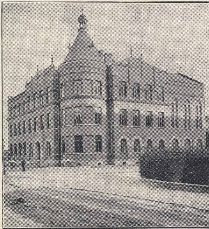
Skolans nuvarande byggnad vid Södra Vägen.

Det antal elever, som intogs första året, var som redan nämnts 15, och åldern växlade mellan 8 och 15 år. Så småningom ökades lärjungarnas antal, först till 20, så till 24, slutligen från 1847 till 30, vid hvilken siffra det förblef till 1863. Intagningen föregicks af ett prof. Något