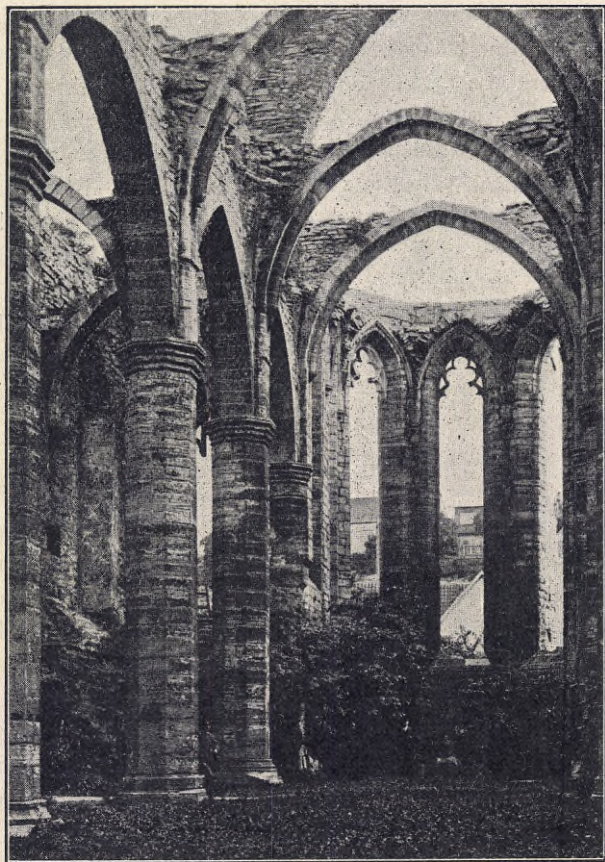
S. Carins ruin.

På den tiden, när muren stod där med sina tinnar