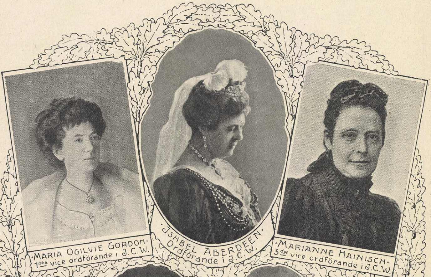
MARIA OGILVIE GORDON. 1 sta vice ordförande i J.C.W.

Styrelsemedlemmar och delegerade vid mötet.