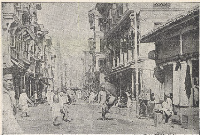
GATA I BOMBAY.

kunde vara en bit London eller Antwerpen eller Dresden. Mellan dessa gator och västra stranden ligger en vidsträckt park med kort gräs, ett stycke ditflyttad Hyde Park. Där åker hvarje eftermiddag den europeiska Bombaysocieteten omkring i sina ekipager med grannt klädda infödingar som kuskar och lakejer. Om dagarna hålla sig damerna instängda af omsorg om sin dyrbara hvita hudfärg, deras ras- och adelsmärke; men fram mot solnedgången komma de dit, och herrar och damer stiga ur och promenera omkring och idka säll-