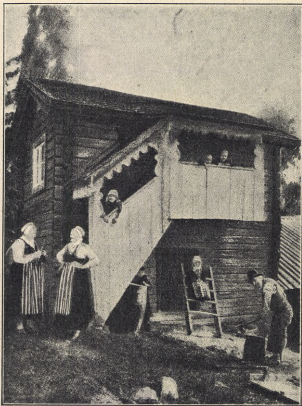
Så ser den ut.

Och sommaren gick med ständigt nya öfverraskningar. Täppan började lysa grannt af krasse och ringblommor, kring fönstren slingrade sig tropiskt frodiga rosenbönor, och i köksträdgården skördade vi stolt ärtsängen. Det blef till ett helt mål. Men den ensamma, själsädda bondbönsplantan fick stå orörd som prydnad. Jordgubbslandet var stort som en åker och igenvuxet med meterhögt ogräs, och ändå bar det oförtrutet, så att vi inte kunde ta vara på allt, fast kråkorna hjälpte oss. Krusbärs- och vinbärsbuskar voro lika outtömliga, fast vi fabricerade ett helt lager rhenvin. Och sent på nätterna arbetade vi i det stora köket, och en förbigående kunde trott sig se ett häxkök, där vi sysslade vid den öppna spiseln och rörde i den stora syltgrytan. Det var nästan en lättnad, att det stora körsbärträdet strejkade, och apels surkartar fingo sitta kvar. Det förlät vi dem ändå hvarje vår, när de stodo öfversällade af hvit blom, om de också aldrig uppfyllde löfena. Plommonhagen och krikonlunden i hvar sitt hörn af muren visste bättre sin plikt, och långt in på hösten voro vi upptagna af skörd, t. o. m. nypon, rönnbär och svamp öfverflödade. Det var vår hvila, och det hade en underbar förmåga att