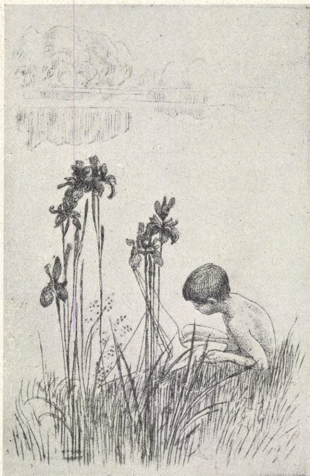
Carl Larsson: Vattentiljor (etsning).