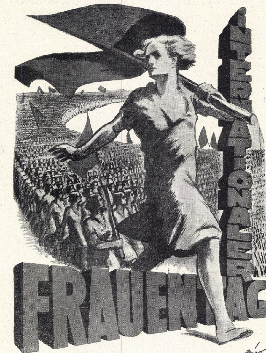
Internationella socialdemokratiska kvinnodagens affisch i Tyskland.

Om, sedan de äro fyllda, jordröntan och åtskilliga andra räntor skola avskaffas; om arvet skall upphöra; om produktionsmedlen skola förstatligas — alla dessa frågor föreligga icke nu. De äro morgondagens. Dagens omsorg är att göra arbetarnas villkor människovärdiga. Inser morgondagen att samhällets sundhet, styrka och skönhet fordra de sistnämnda åtgärderna, då blir det morgondagens uppgift att finna utvägarna för dem. Nu ligger samtidens väg full av uppgifter, som en för en måste lösas — vilka följder än detta