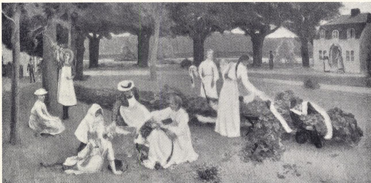
Georg Pauli: Midsommar.