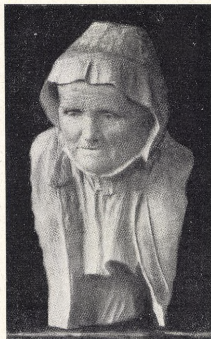
Anders Zorn: Mormor.

Då mormor fyllt 17 år, kom den unge, ståtliga knekten för grannroten och friade till henne. Det hade aldrig varit