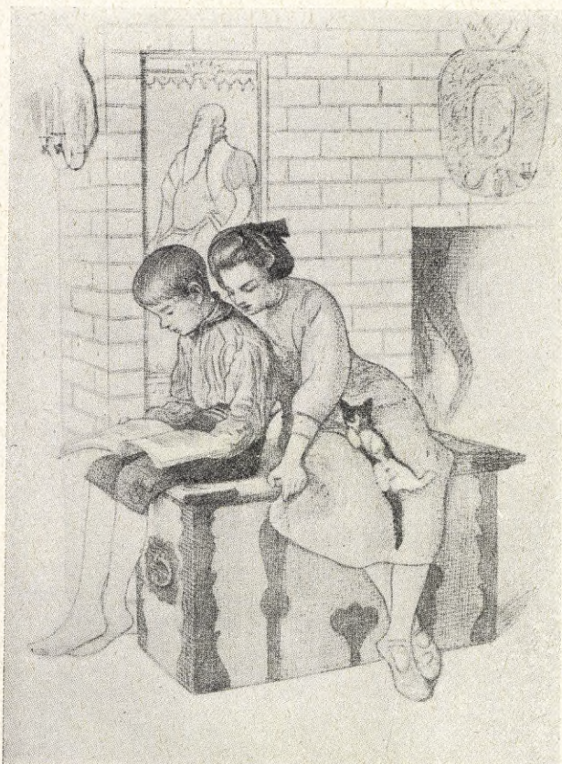
Carl Larsson: Bilderboken.

att vi böra försvinna så att de kunna få dansa. Något som tolereras då man beräknat att dessa ungdomar skola dansa in kassan, som var meningen med detta möte. Våra Folkets Hus behöva pengar — men skulle det icke gå att förena det ideella och det praktiska? Våra Folkets Hus kanske kunde bliva mera