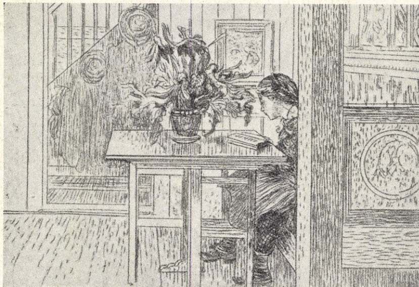
Carl Larsson: Lisbeth läser.

Vad skall göras för att dessa möten skola ge det de innerst sträva till? Om dessa möten ordnades med kulturellt innehåll, väckande för socialt arbete eller spridande av kunskaper, som för hemmens vård, barnens fostran eller barmhärtig inställning vore erforderlig, hade det ett visst berättigande. Det gav omväxling samtidigt det gav näring till själen, ty innerst inne är det en själens hunger, som är drivfjädern fast de själva icke göra detta klart för sig.