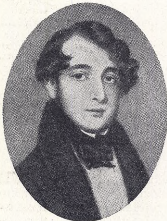
Charles Dickens vid 23 år.

Oliver Twist är otvivelaktigt Dickens starkaste men också hans mörkaste bok. I den finns ej den svagaste reflex av den allförlåtande humor, som eljest mer eller mindre lyser upp i alla hans andra böcker, i den skrattar han icke högt och hjärtligt eller ler i mjugg åt företeelserna och människornas