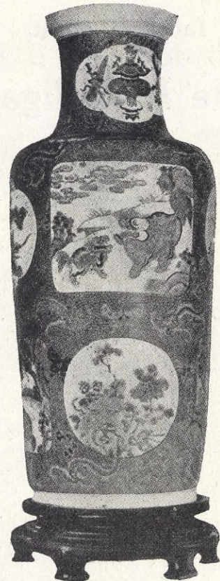
Kinesisk vas från 1600-talet.

Sedan motionen väcktes ha flera uttalanden i frågan varit synliga i pressen och däribland av prof. Forssner. Det finns rent sociala anledningar, säger han, för att av-