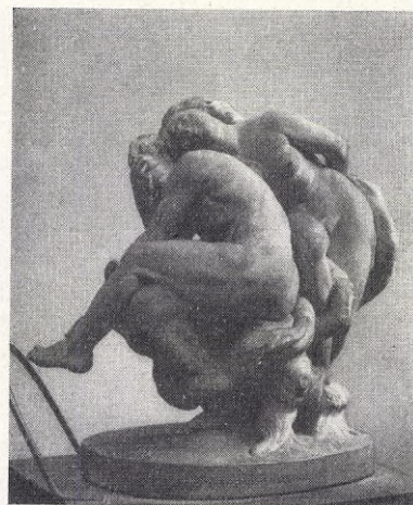
Antoine Wiertz: Andra epoken: Passionernas födelse.

Den skrevs 1885 i en tidskrift "Ur dagens krönika" (utgiven av Arvid Ahnfelt) i vilken tidskrift Strind-