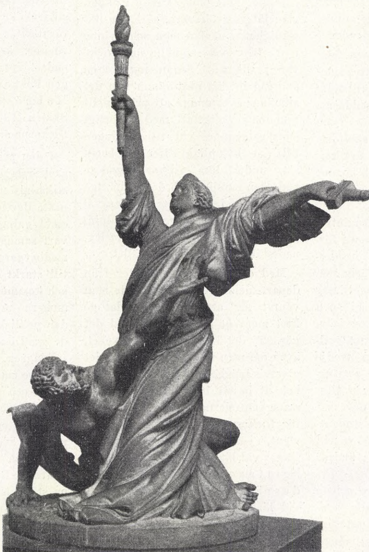
Antoine Wiertz: Tredje epoken: Ljusets triumf.

Beträffande den förstnämnda innebär förslaget faktiskt att folkskolan obligatoriskt blir grundvalen för de högre skolorna, och här tillmötesgår man alltså det gamla demokratiska kravet på folkskolan som botten-skola. Förslaget stipulerar nämligen att på varje läroverksort möjligheter skola finnas till omedelbar övergång från folkskolans sjätte klass till realskola.