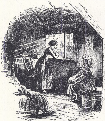
Lilla Dorrit berättar sagor.

läggande av förhållandena är vad många önska, så att man kan få ett nägorlunda klart begrepp över hur förhållandena gestalta sig på förläggningarna och vilka av A. K:s ukaser som måste ändras.