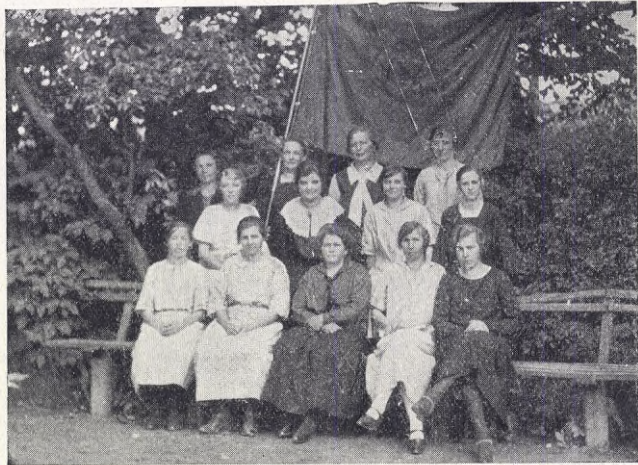
Skivarp soc-dem. ungdomsklubb.