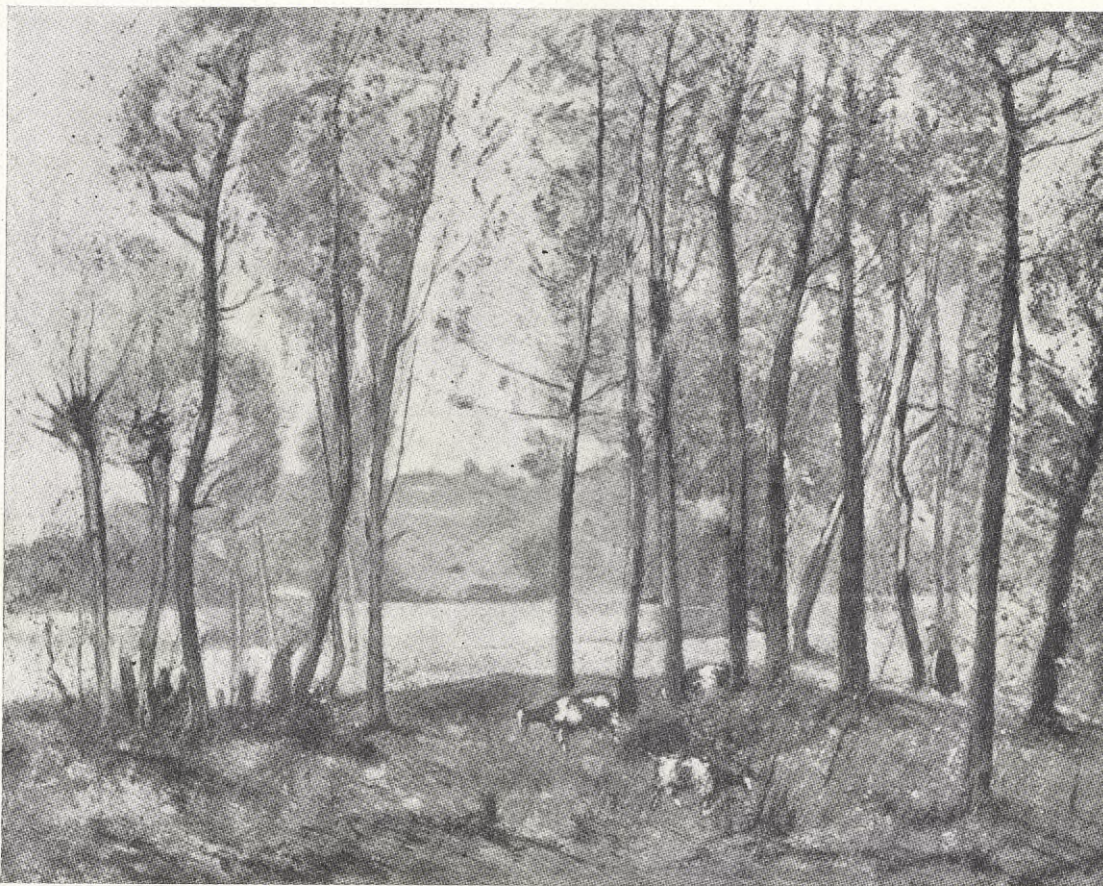
W. A. Gibson: Landskap.

icke helt beräkna hur många som skulle gripa detta utkastade limspö. för att, utan att behöva räknas bland dem som ej ville reformens genomförande, kunna komma ifrån ett avgörande beslut. Majoriteten blev