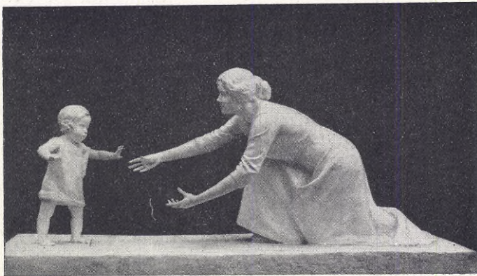
G. Bricard: De första stegen.