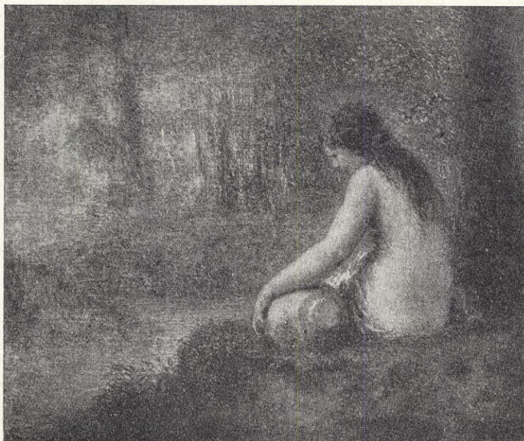
Henri Fantin-Latour: Vid källan.

De tjeckoslovakiska kvinnorna utveckla en livlig verksamhet både genom organiserandet av särskilda kvinnogrupper inom varje politisk organisation samt ge-