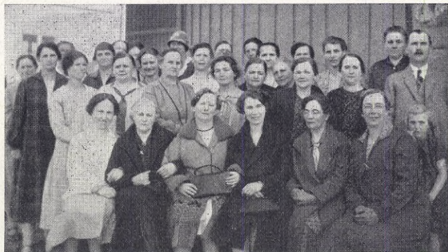
Deltagare i Hallands soc.-dem. kvinnors årskonferens.