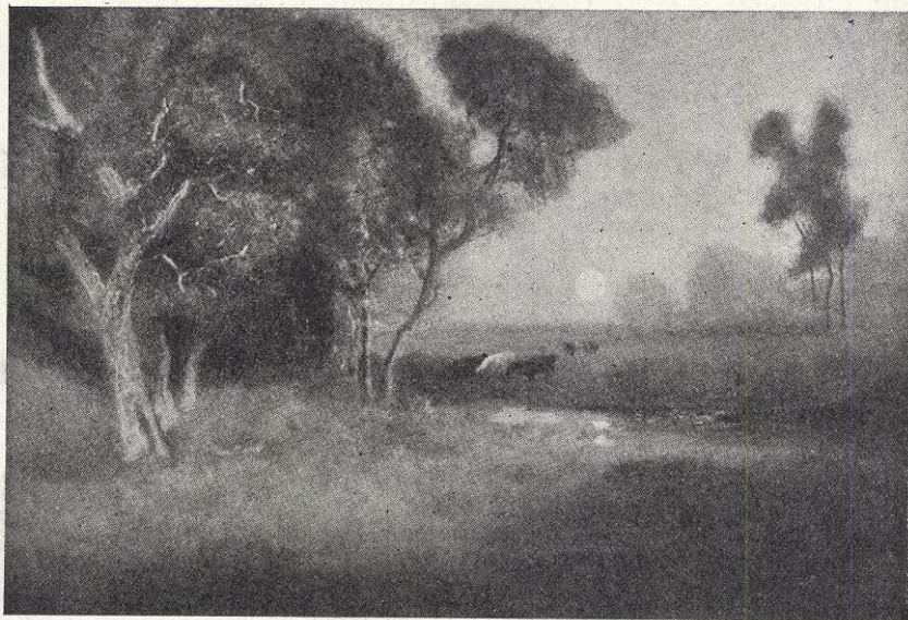
W. Keith: Mänskenslandskap i augusti.

att det inte är fint att ge svinen mat och mjölka korna. Det arbetet måtte väl duga, som matmor själv lärt henne.