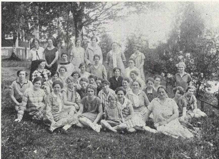
Deltagare i kursen på Brunnsvik den 3—15 juli.

De av A. B. F. anordnade kvinnokurserna på Brunnsvik ha varje år rönt en rekordartad anslutning. Anmälningar ha inströmmat från långt flera än det varit möjligt att bereda plats. Detsamma har varit förhållandet vid året kvinnokurser.