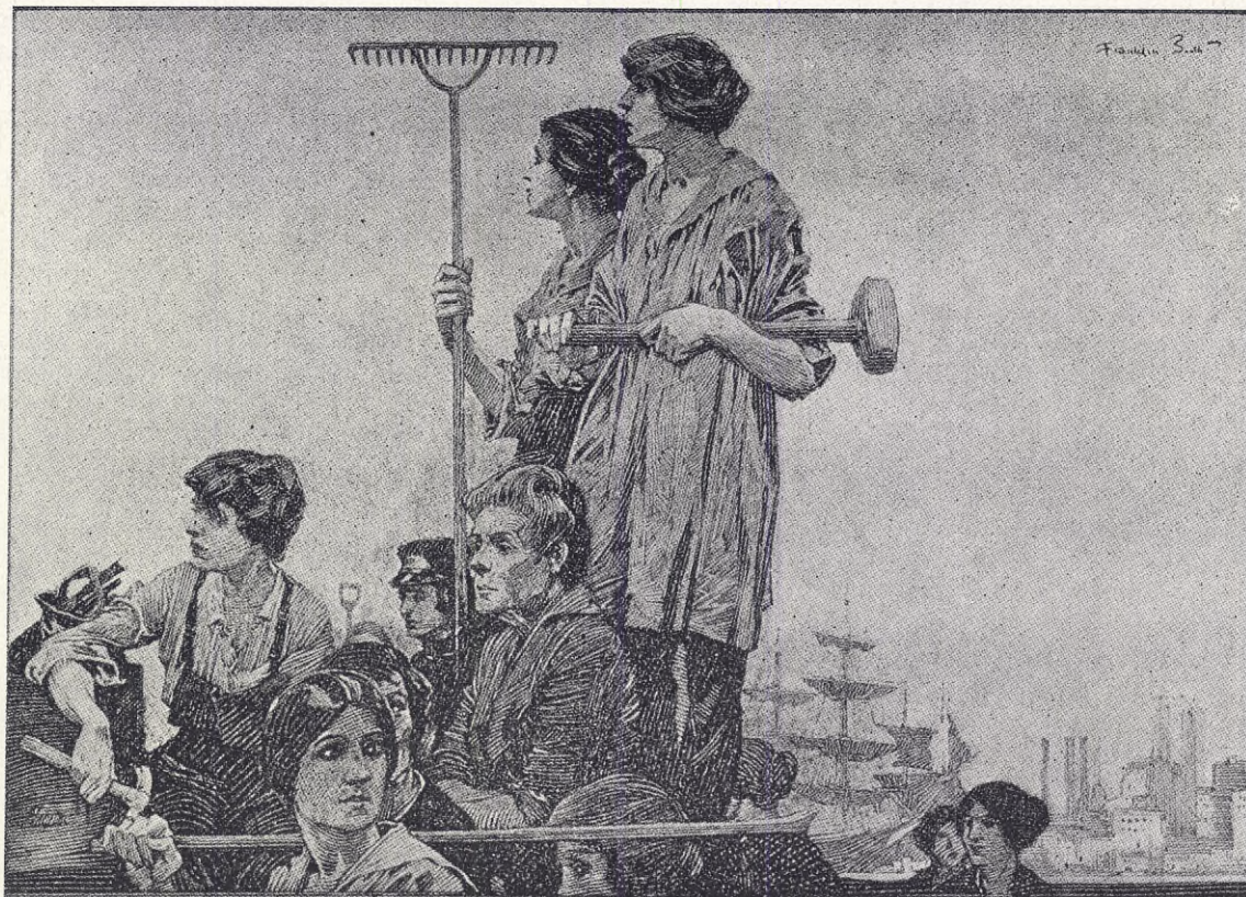
Arbeterskor. Pennteckning av Fr. Booth.