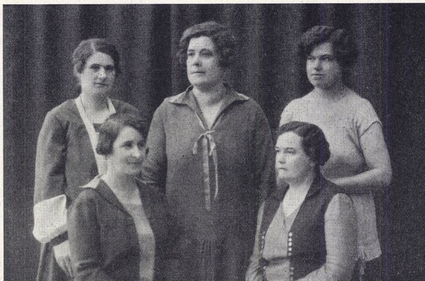
Sundbybergs kvinnoklubbs styrelse.