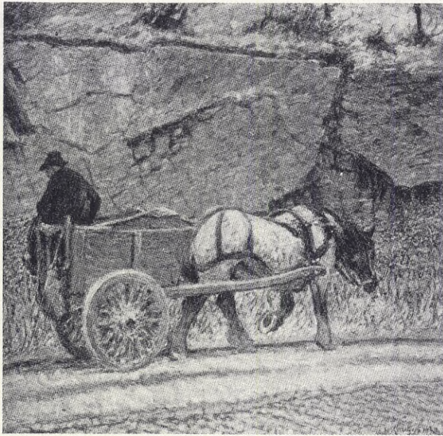
Nils Kreuger: Gatubild från Högalid, Stockholm.