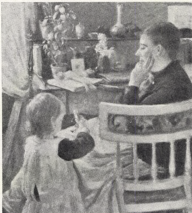
Nils Kreuger: Mor och dotter.