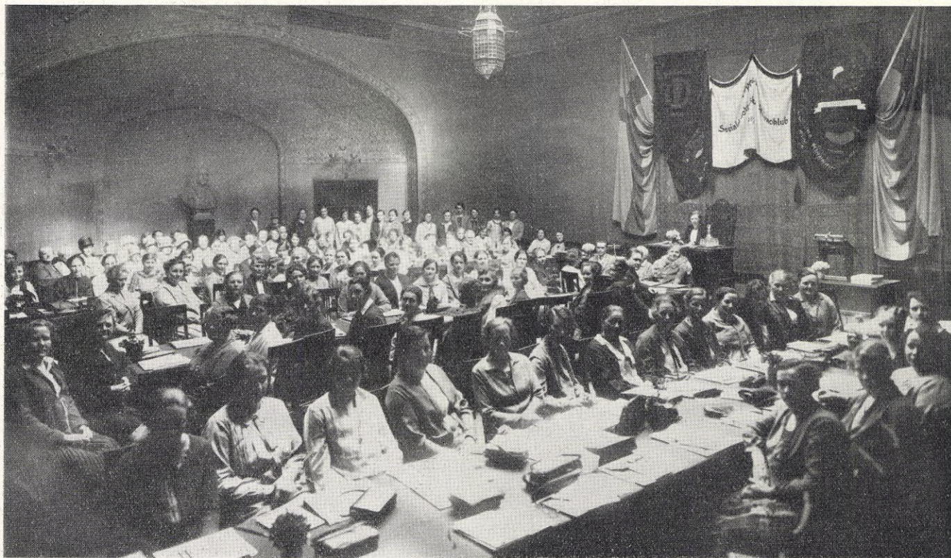
Kvinnokongressen 29 maj—2 juni 1928.

En kongress är ju som allt annat här i världen ett omtvistat ting. Inte så, att själva idén att hålla kongresser och konferenser i och för sig äro saker, som det tvistas om. Tvärtom torde kongressande vara rätt omtyckt av de flesta, som aktivt deltaga i en rörelse. Vad som däremot alltid blir föremål för utläggningar är kongressens arbete och de beslut den fattat. Detsamma gäller naturligtvis också kvinnokongressen. Skola vi själva ge oss in på ett bedömande, så torde detta icke kunna bliva i full överensstämmelse med