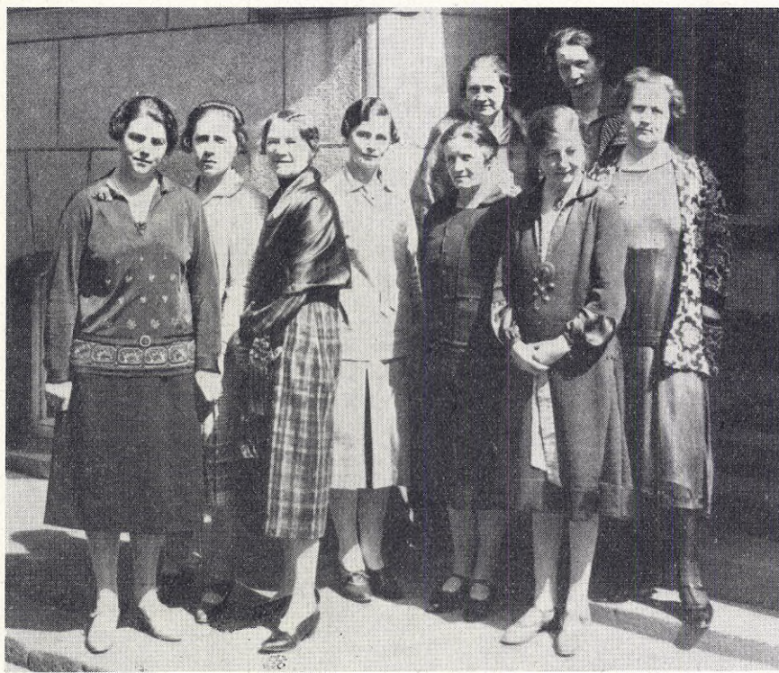
Förbundsstyrelsens landsortsrepresentation jämte suppleanter.