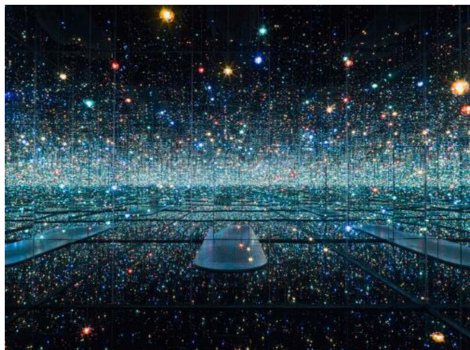
Kusama, Y. (2013) Infinity Mirrored Room - The Souls of Millions of Light Years Away .

Deleuze och Guattari kallar den differentierade substansen av flöde för rhizom . Rhizomet gör inte anspråk på någon evig sanning. Från specifika situationer kan flyktiga spatio-temporala sammanhang extraheras från kontexten och bilda en temporär förståelse av verkligheten. 142 Det är en icke-metaforisk bild av världen som ett immanent genererande flöde där deleuzianska kroppar aktivt möts och sammankopplas med varandra. Eftersom kroppar i rhizomet är ständigt öppna för sammankopplingar, är kroppen alltid redan någonting annat än endast isolerad. 143 Det skapas och skapas av ett heterogent system uppbyggt av kroppar, materia och rörelse. 144 Kroppar såsom diskurser, institutioner, byggnader, lagar och makt kommunicerar, konsumerar, påverkar och påverkas. Material slingrar och viker sig dubbel och avig mellan filosofi, fysik och metafysiska konstruktioner. 145 Det är ett ontologiskt maskineri, en process av kroppar i tillblivelse. Helheten är en utplattad massa, en horisontell friktionsfri yta, utan hierarkier. Aldrig isolerad utan ständigt sammanflätad. Verkligheten är en pluralistisk substans eftersom kroppar lever i ständigt beroende till andra kroppar. 146 I grunden är vi alla trots allt, oavsett livsform, uppbyggda av olika sammansättningar av stjärnstoft.