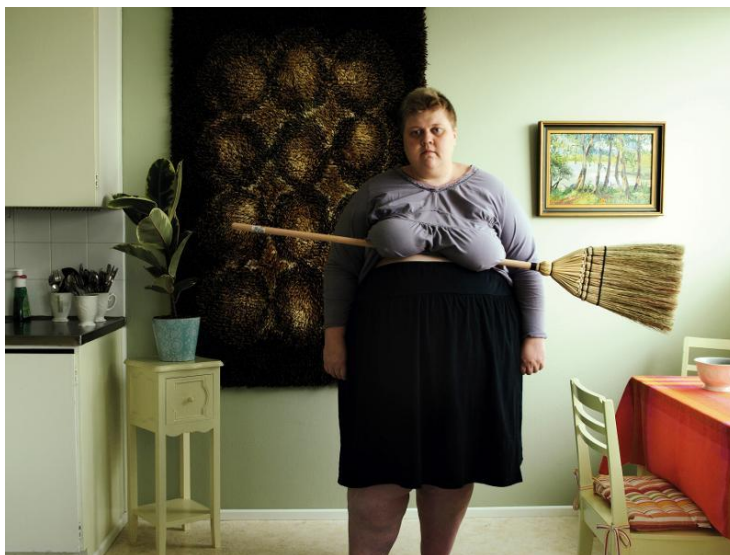
Susiraja, I. (2010). Luuta .

Kvinnor har genom historien förknippats med ondska. I häxprocesserna under 1400- till och med 1600-talet utpekades kvinnor i den kristna världen som samhörande med djävulen. Enligt bibeln var hon ett lättpåverkat byte som kunde användas som verktyg för att lura män, och skulle därav straffas. 333 En teori som har lagts fram om varför just en så stor andel av de anklagade var kvinnor har varit rättsordningens vilja till en förklaring av det oförklarliga, en logik som förklarar det som avvek från normen. 334 Magi bedöms som rationellt oförståeligt. Det oförståeliga tillhör det onda, då den största tilltron alltid hängivits det ordnade förnuftet och den gudomliga sanningen. Magi är ett förhäxat väsen som avviker från normen, och som till varje pris måste utrotas. Häxprocesserna anses därför vara ett sätt för övre makter att trycka tillbaka andra anti-krafter. 335