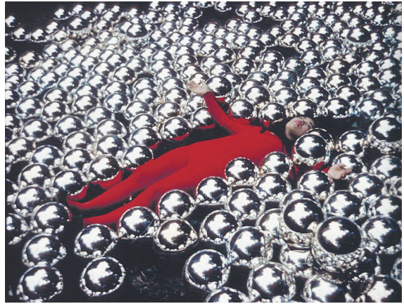
Kusama, Y. (1966) Narcissus Garden .

formulerar en epistemologisk deduktion i uttalandet ” Je pense, donc je suis ” 100 , där människans hela existens grundas i hens tänkande. Det är en tydlig uppdelning av kropp och själ som fortfarande idag har bäring på vår kunskapsproduktion. 101 Makt grundas i skillnader som betraktas som ofrånkomliga och därmed transcendent moraliska. 102 Det är en idé om tänkandet som en exklusivt mänsklig förmåga som trumfar alla andra livsformer. Människan anser sig genom förnuftet vara berättigad till makt och överordning. 103 Den