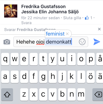
Säljö, J. (2017). Screenshot.

med ondska. 337 Kvinnan och katten har ett särskilt kroppsligt band. En äldre kvinna som sällskapar med katter ses som en ”patetisk hagga”. 338 Att en kvinna med många katter skulle vara en ensam kvinna är i sammanhanget felaktigt. Grumpy Cats och Bundesens relation är affirmativ, bejakande och bygger på ömsesidig omsorg. Syftet med det här avsnittet är att återta smeknamn såsom hynda, bitch, hagga och häxa: feminiserade skällsord som traditionellt och historiskt kopplats till djurisk ”naturlighet”. Grumpy Cats bittra uppsyn kan därmed vara ett verktyg i den feministiska kampen. Svedmarks digitala smuts, som nämnts ovan, bygger på hennes läsning av antropologen Mary Douglas definition av ”smuts”. Douglas beskriver smuts som ett kulturellt fenomen som definierar oönskad och malplacerad materia. 339 Grumpy Cats dvärgsyndrom, en blind hund, en gammal hagga eller en tjock och skägig kvinna är kontaminationen av det rena och kyska. Den digitala smutsen river ner det rumsrena intrascapet och ställer sig i opposition mot kategoriseringar och dikotomier såsom mänskligt och icke-mänskligt.