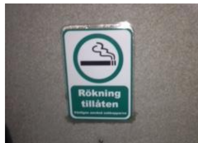
Modin, F. (2017) Rökning tillåten .

Normer har konsekvenser för hur kroppar rör sig genom rum, och vilka känslor och begär som produceras. Det avgör vem eller vad som får vara på en viss plats, och vilka kroppar som kan kopplas med andra kroppar. I lawscape flödar kapital över gränser, medan barn dör på Medelhavet, eftersom lawscape tillåter en sådan flödesordning. Kvinnor tar omvägar hem från krogen medan en hund kopplas utanför ICA, eftersom det, som Norrköping tingsrätt skulle uttrycka