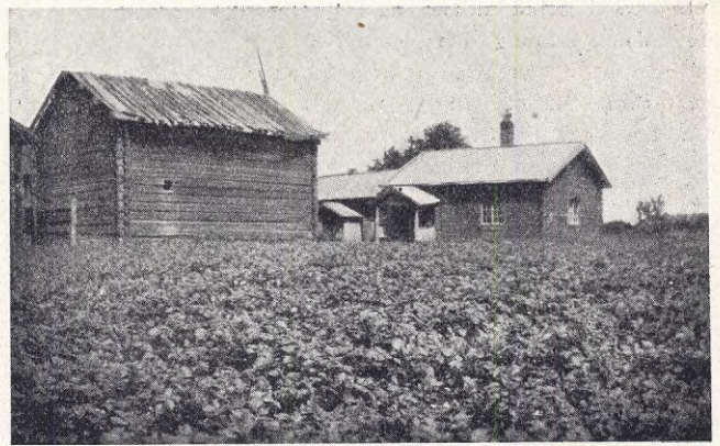
En sjuttonhundredtalsgård i Orsa.

Kom och bjud en amerikansk ar- betarefamilj ett rum och kök! Den,