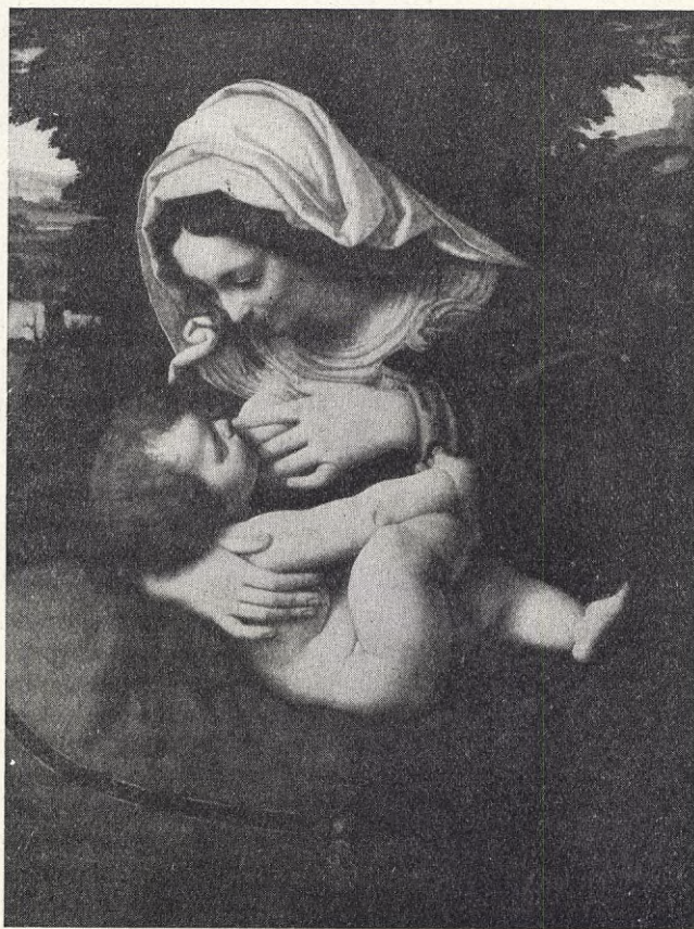
Moder med barn.

Sålunda hade hon trots allt både sympati och erkänsla, dock den me-sta sympatien och de flesta vännerna bland byalagens getter, vilka alla voro som hemma vid hennes fjäll och trivdes förträffligt under hennes vård, stodo stilla som ljus och idiss-lade, när hon i solnedgången mjöl-