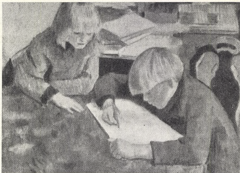
Erik Werenskiöld: BARN.

När det gäller de små hemmen, arbetarehemmen, är det så mycket mer oönskligt, som det oftast är det enda medel, varvid vi kunna ge ett innehåll åt vårt hem. Det finns ingenting som ger en sådan värme, en sådan känsla av liv som den personliga omtanken eller där man märker att varje ansats till förbättring kostar möda och bekymmer. Vi veta ju, att allt som kostar möda att skaffa hålla vi en särskilt värdande hand över. Vi ha så bedrövtligt många möbelmagasin även i arbetarehemmen, men så få verkliga hem. Det är de verkliga hemmen vi behöva eller rättare, vi behöva bevara själen i våra små hem. Visserligen är det bra mycket bekvämare att låta möbelhandlaren eller grannarna, där vi bo, vara utslagsgivande när det gäller de yttre betingelserna, d. v. s. inredningen av hemmet, än att låta det växa fram så att säga under våra egna händer eller, med andra ord, skapa oss ett hem med litet i taget efter vårt eget kynne och efter vår egen smak och framförallt efter vårt behov och våra möjligheter. Det är visserligen bekvämare att vid varje liten detalj man vill öka trevnaden med, skriva och fråga en