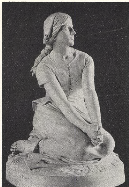
H. CHAPU: Jeanne de'Arc.