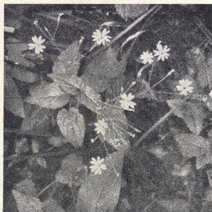
Lundstjärnblomma. Ur "Färder och fåglar".