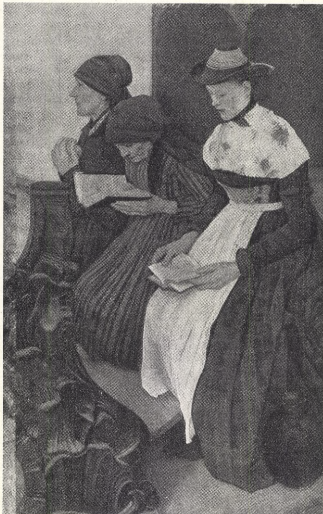
V. Leibi: TRE KVINNOR I KYRKAN.

Men så grep han bäst det var, plötsligt och nervöst hennes ena hand i båda sina och sporde i nästa stund ivrigt och i en ton nästan som om det gällt hans arma liv — om hon då icke alls kände igen honom? — Hon såg ju så undrande och frågan-