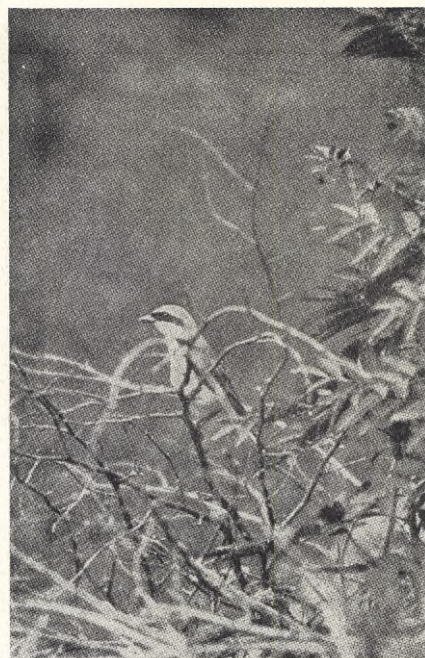
Törnskathanen på utkikspost. Ur ”Färder och fåglar”.

Hur skall barnavårdsmanen kunna avskaffa nöden? Var står det skrivet att barnavårdsmanen skall kunna göra det? Vad har barnavårdsmanen för resurser till det? I alla de fall där barnavårdsmanen får veta att en mor eller ett barn lider nöd, framför han genast sin klients sak till fattigvårdsstyrelsen. Det är denna som skall avhjälpa nödtillståndet. Lagen tillägger skynndsamt! Det vore bäst om jag slapp lägga fram mina samlade erfarenheter om fattigvårdens skynsamhet, men den allra färskaste kan jag ej neka mig nöjet tala om i detta sammanhang. En kvinna satt i ett oeldat rum med sitt fjorton månader gamla barn. Fästmannen hade övergivit henne. Hon väntar ännu ett barn i nästa månad, kan således ej arbeta och förtjäna sitt uppehälle. Underrättad på torsdagseftermiddagen om situationen, skrev jag genast en skrivelse därom till fattigvårdsstyrelsen, som hon personligen fick lämna på fredagsmorgonen. Samma kväll ringer hon till mig och talar om att hon på den ansökan, i vilken jag skildrat hennes belägenhet och bitt om skynnsam hjälp i form av ved och kontanter, fått till svar att komma igen om fjorton dagar för att få besked. Det blev för mig en hel eftermiddags telefonerande till den ena efter den andra av denna fattigvårdsstyrelsens medlemmar,