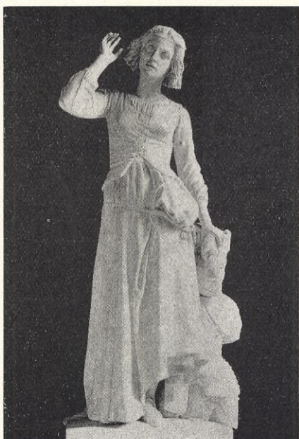
E. RUDE: Jeanne d'Arc.