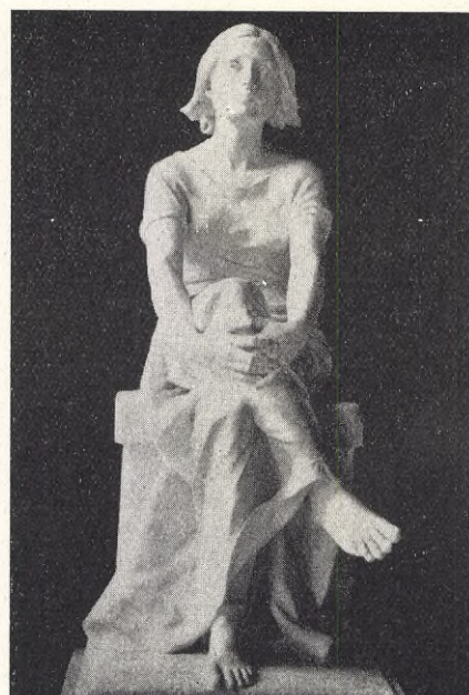
A. BOUCHER: Jeanne d'Arc.