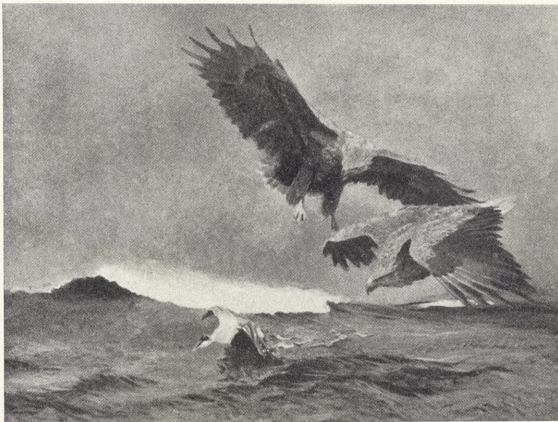
Bruno Liljefors: HAVSÖRNAR.

Därför har också detta förbud varit i stor utsträckning utan sin skyddande betydelse, ty har den fattiga