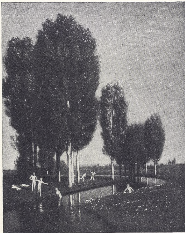
MÅLNING AV BÖCKLIN.