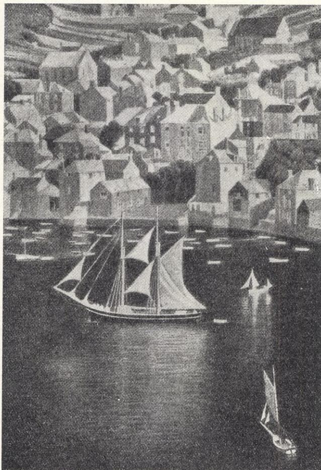
MÅLNING AV JOSEPH SANTHALL.

För domstolarna spelar numera brottslingens rent personliga förhållanden en stor roll. Man kan säga, att det utmärkande för rättsväsendets utveckling under de senaste decennierna varit, att den brottslige, ej brottet, trätt i förgrunden. Domstolarna ha också stor möjlighet att individualisera vid straffets utmätande. Så tillämpas ju ofta villkor-