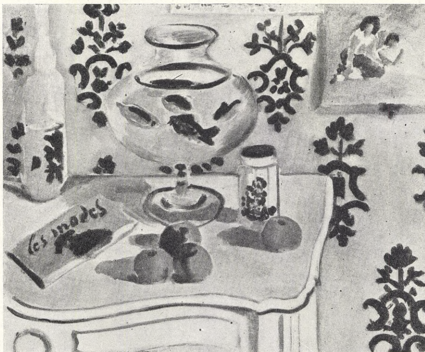
Henri Matisse: STILLEBEN.

grupp som det inte nämnes ett ord om i utlåtandet, nämligen arbetareklassens kvinnor. Det är högst få av dem som äro ute i förvärvsarbete vilka hava en beskattningsbar inkomst av 3,000 kr. och hustrurna falla ohjälpligt.