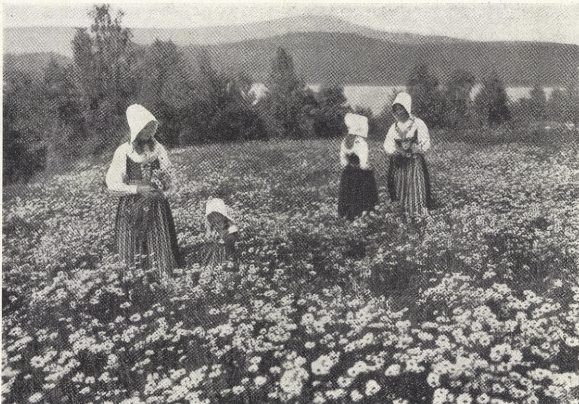
SOMMAR I DALARNE.