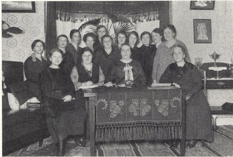
Vännäs soc.-dem kvinnoklubb.