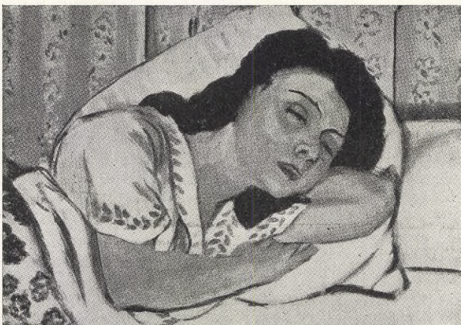
Henri Matisse: SOVANDE FLICKA.