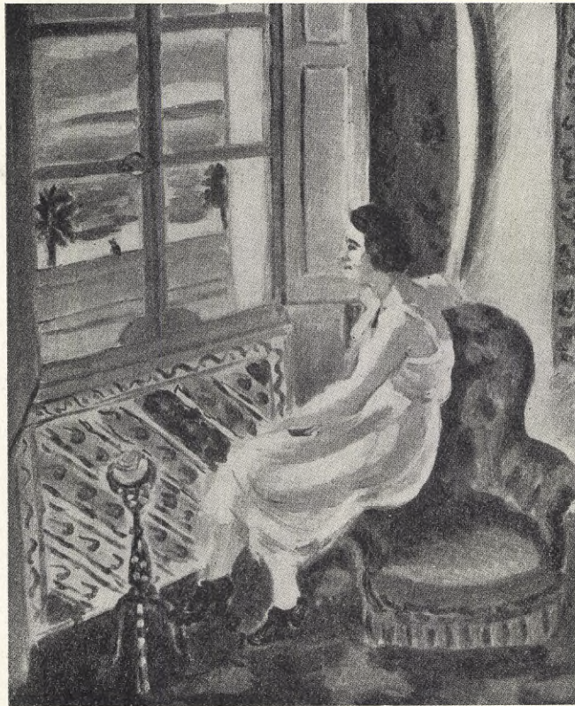
Henri Matisse: STORMEN.