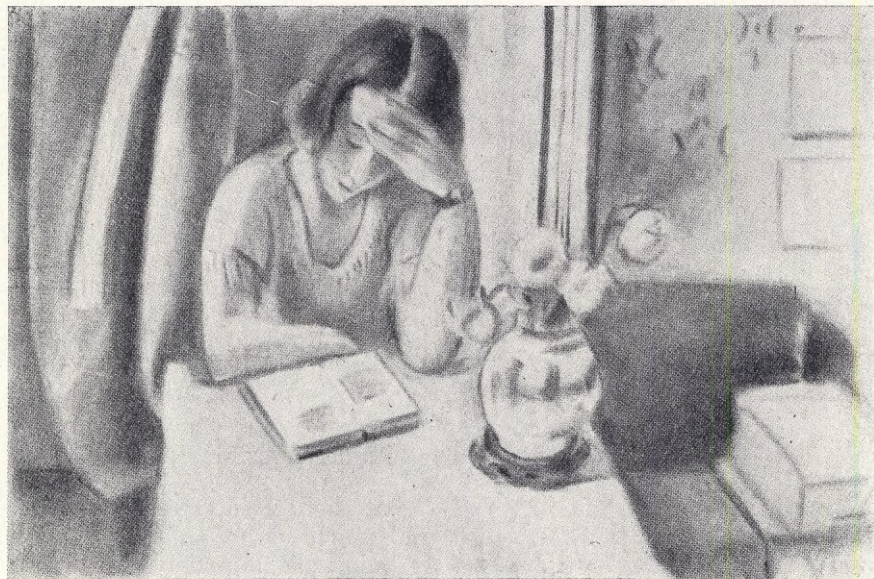
Henri Matisse: STUDIE.

Matisse har om sin konst sagt, att han arbetar så mycket och så gott han kan. Om man kritiserar och ogillar hans verk rår han inte för det, ty var fågel sjunger ju efter sin näbb, och något annat kan man inte göra. Han är alltså en ärlig och anspråkslös natur, och det är inte hans fel om en skara fantaster, som med en stor gest förkastat det gamla och allt vad det givit, störtat sig över honom och utropat honom till messias, då han i verkligheten blott är en av de sökande, pionjärerna på de nya markerna.