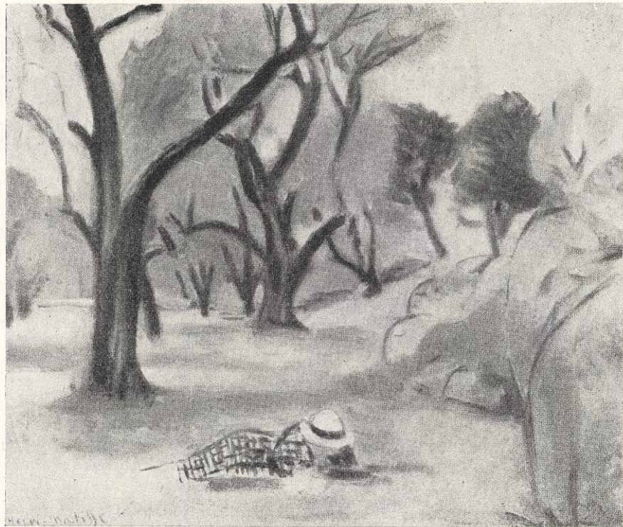
Henri Matisse: OLIVSKOG.

mer renas och förädlas, ty det goda är tillika skönt. Intet har mer skadat det godas framgång än den inbillningen, att det goda är något för vårt skönhetssinne frånstöta. Men ju klarare det framträtt, att det goda och det sköna stå i förbund med varandra, desto mer har det goda dragit hjärtan till sig. Och det är just de goda fantasibildernas skönhetsprägel, som förlänar dem en sådan makt över viljan. Det veta också de, som driva propaganda för det onda. Och därför förskapa de sig till ljusets änglar och bedraga med det fagra skenet. Ja, det råaste brott kunna de förgylla. Och att blott så få märka sveket, det vittnar om huru ytligt skönhetssinnet hos de flesta är, och huru lågt fantasikulturen i allmänhet står trots jättesteg på andra bildningsfält.