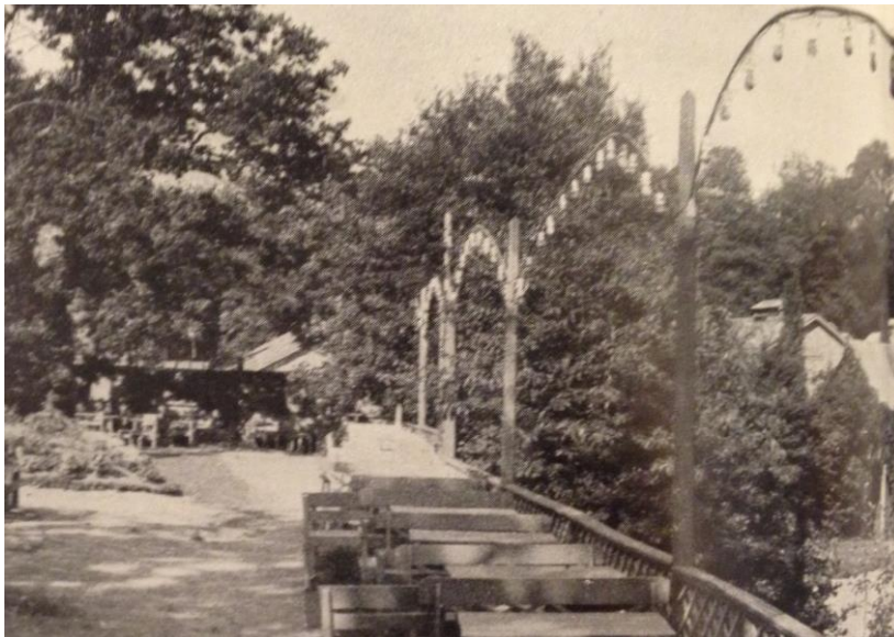
Bild 8. Hjulksvarnelund och Folkets park (Jubileumsskrift Folkets park Trollhättan 15 år, 1945)

I Trollhättan har industrialismen haft mycket stor betydelse för stadens utveckling. Den främsta orsaken var läget vid Göta älv och vattenfallen. Innan slussarna byggdes runt år 1800 fanns det ingen stad vid vattenfallen, utan kvarnar och några hundra invånare. I början av 1900-talet tillkom vattenkraftsstationer och på 30-talet bildades de stora industrierna Nohab Flygmotor, Saab och Vattenfalls kraftstation, vilka alla hade mycket stor ekonomisk betydelse för Trollhättan (Johansson, 1987; Olsson, 2014).