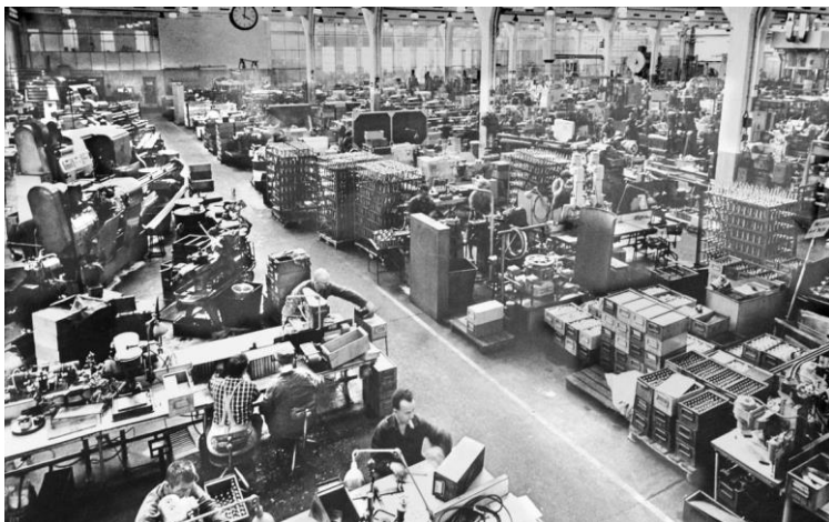
Bild 13. Ammunitionsfabriken verksamhet i lokalerna inne i berget. (Wreime, okänt årtal)

Den sprängtekniska verksamheten avslutades 1994 och Zakrisdal är numera ett område för annan typ av industri. Området blev fridlyst och stängt för allmänheten, för att det eventuellt kunde finnas farliga rester från ammunitionsfabriks-verksamheten. Området har dock sanerats noggrant och fridlysningen upphävdes 1995 och blev därmed öppet för allmänheten (Bylund, 2017; Sandgren, 1983).