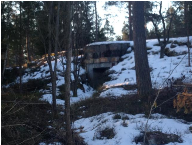
Bild 10. Zakrisdal, gräsbeklädd industribyggnad i skogen (Fock Nilsson, 2018).