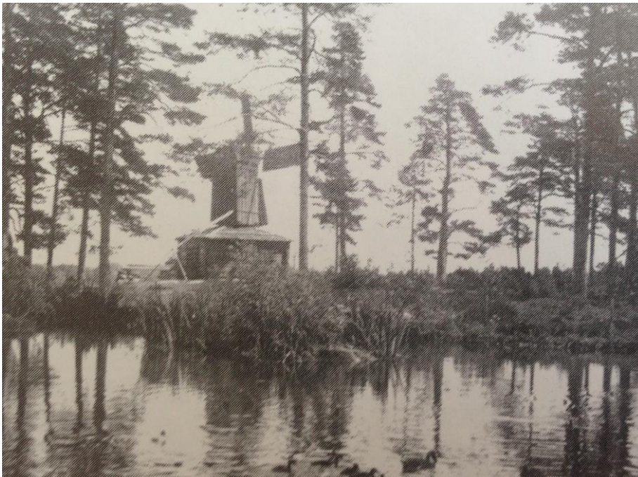
Bild 4. Fågeldammen i Mariebergsskogen (Värmlands museum, årtal okänt)

Friluftsmuseet utvecklades efter de ursprungliga idéerna under alla år och i ett avtal från Mariebergsskogsutredningen 1956 fastslogs det att verksamheten skulle bestå av: museal verksamhet, fest- och nöjesplats, allmän park öppen hela året, barnvänliga aktiviteter och djur som förekommer på svensk lantgård. Naturum Värmland invigdes 2002 och innehåller utställningar, butik och café. Där hålls också guidningar, föredrag och exkursioner (Edberg, 2005).