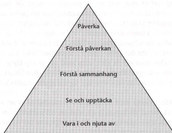
Figur 2. Naturskolans syn på individens utveckling. (Hedberg 2004 s.68)

Han skriver vidare om hur man kan arbeta med och problematisera skolans ämnen utomhus.