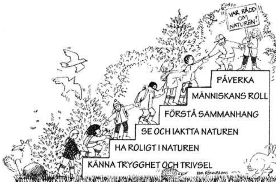
Figur 1. Ericssons utvecklingstrappa. (Ericsson 2002 s.6)

Hon fortsätter vidare med att lärande som har utgångspunkt i den direkta upplevelsen och i en process där barnet är aktivt sätter varaktiga spår. Att påverka attityder och värderingar är en långsiktig process. För att dessa ska kunna påverkas krävs det att uteaktiviteter blir något kontinuerligt och inte bara engångsföreteelser. Ericsson menar att skapa en naturkänsla hos människan måste vara att skapa en ödmjukhet för den vardagsnatur hon har runt om sig. Processen att utvecklas till en ansvarstagande samhällsmedborgare beskriver hon i sin utvecklingstrappa: