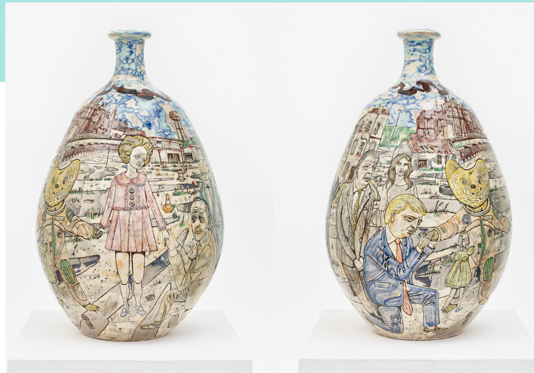
Grayson Perry - Alan Measles and Claire Visit The Rust Belt (2017)

När jag varit på utställningar och sett Perrys urnor har jag haft svårt att relatera till och med dem. Jag har haft svårt att känna något alls, vilket har frustrerat mig då jag skarpt uppskattar historierna Perry berättar om - den lilla människan i den stora världen. Människor i min omgivning kopplar ständigt ihop mig med Perry och det är något jag förstår, då jag också målar människor på stora urnor. Men jämförelsen är också något jag haft svårt för. Efter funderingar kring varför hans urnor ger mig en opersonlig icke-känsla har jag kommit fram till att det är för att jag upplever hans figurativa gestaltning som väldigt schablonartad. När den här insikten formulerade sig i mitt huvud blev det plötsligt klart för mig varför jag har svårt för att tycka om dem. Under det här projektet har jag kämpat med att släppa mina inprogrammerade mallar och regler som talat om för mig hur en människa ska avbildas. Jag har målat på lera just för att jag vill komma ifrån schablonerna av hur saker och ting ser ut. Perry jobbar ofta med stenciler och dekaler och därför får hans urnor enligt mig lätt ett klistermärkt uttryck. Men nu i efterhand, när jag rätt ut min relation till hans urnor, har jag lättare att relatera till dem och det känns skönt.