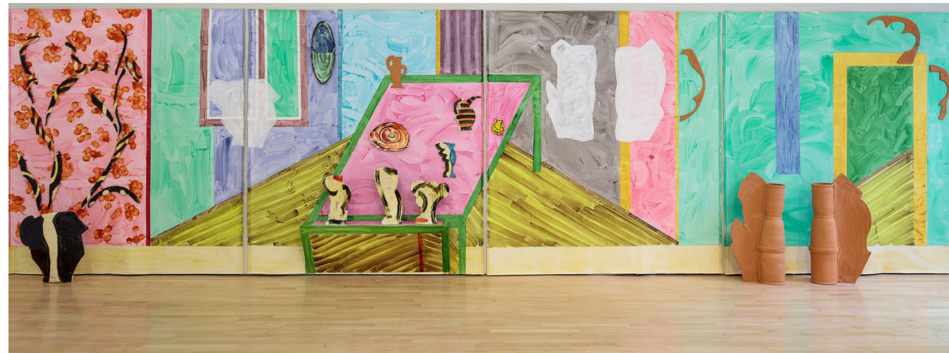
Betty Woodman - The Summer House (2015)

Efter att jag påbörjat mina två sista urnor och låtit delar av motiven lämna urnans runda yta för att istället sticka ut och bli tredimensionella, har jag äntligen känt hur Woodmans arbeten landat i mig. Tidigare har jag tyckt om dem, men inte riktigt vetat varför, och jag har inte heller känt att jag förstått mig på dem. Kanske delvis för att det förväntats av mig, av olika handledare jag haft. Men inte förns nu har jag kunnat översätta henne in i mitt eget arbete. Att låta en del av motivet "sticka ut", och en annan del "fortsätta in" i urnan med hjälp av färg känns väldigt spännande och är något jag vill utforska mer i framtiden.