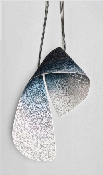
Rabbit Hole - Halsband