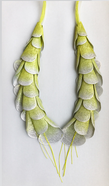
29016 - Halsband