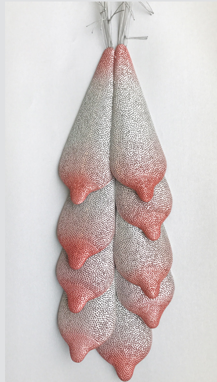
Teats - Halsband