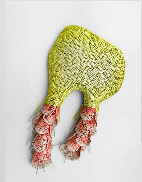
Exo Exo - Brosch