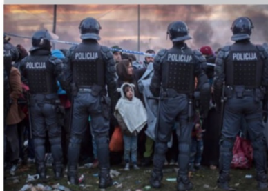
Polis och militär bildar spår vid den slovenska gränsen.

Slovenien. Stängda gränser tvingar flyktingar att ta nya vägar