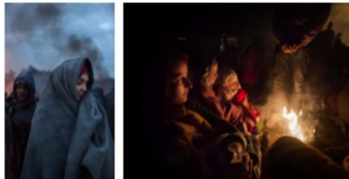
Väntan i Rigence blir lång. Allt som brinner ligger på elden - men kylan tränger ändå under filtarna och kläder.