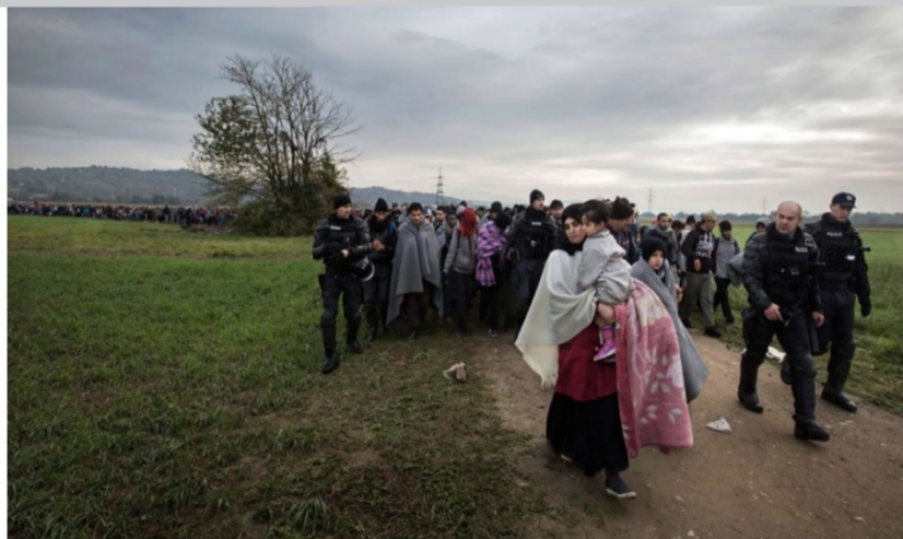
Flyktingarna slussas vidare in i landet och mot Österrike så fort det går. Vägen