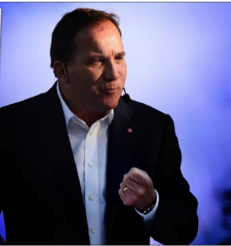
GER SIN SYN PÅ KRISEN Statsminister Stefan Löfven (S) kommer att hålla ett tal på Medborgarhuset i Stockholm i dag. Där kommer han bland annat att ge sin syn på krisen.