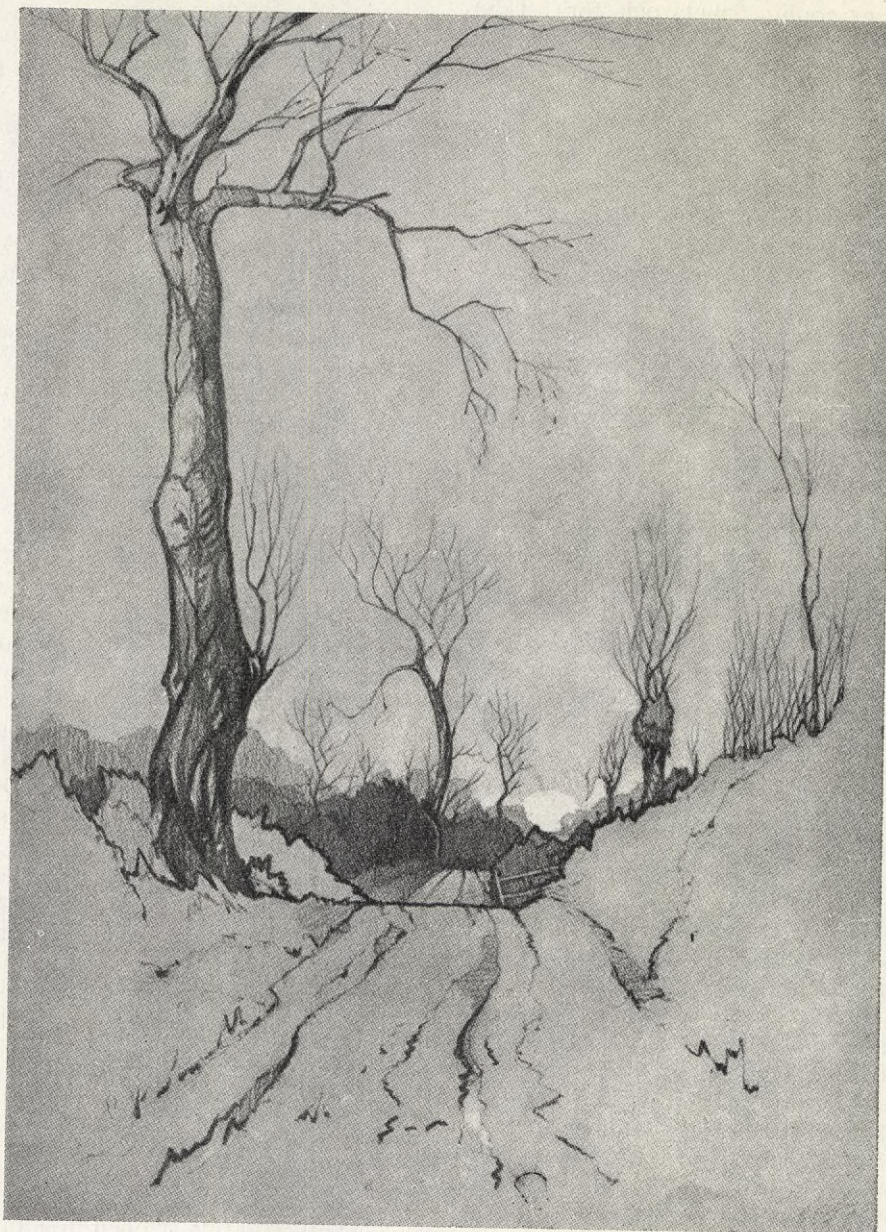
Pennteckning av C. U. Lay.

Dock kan man icke förbigå att nämna den sorgliga avigsida, som medeltidens poetiska kvinnodyrkan hade. Den mänskliga naturen förnekar sig aldrig, och dess yttringar voro säkerligen våldsamma och mera otvivelaktiga hos medeltidens människor än hos de nutida människorna. Därför att den medeltida människan ansåg alla jordiska begär såsom något ont och syndigt, bemödade hon sig icke om att förfina och förädla dessa begär utan gav djävulen vad djävulen tillhörde, och himlen, vad himlen tillhörde. Samme riddare, som i kyrkan avlade ed på att han skulle skydda värnlösa kvinnor, och som böjde knä i himmelsk tillbedjan för sitt hjärtas dam, kunde med berätt mod skända kvinnor och även taga kvinnors liv. Icke under någon tidsålder har det i förhållande till folk-mängden funnits så många brödlösa kvinnor som under medeltiden. De många fejderna och krigen togo många mäns liv och gjorde, att det fanns ett stort befolkningsöverskott