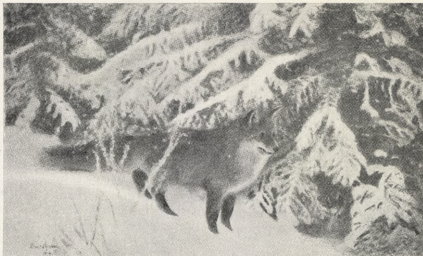
Bruno Liljefors: LYSTRANDE RÄV.

Jag frågar bara: Vad i vår uppfostran? Vilket ämne? Vilken tid?