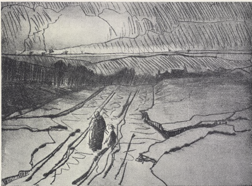
Haagensen: PÅ HEMVÅG.