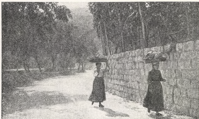
Kvinnor bära hem bröd och grönsaker.

bers vildhet och entonighet och med långa käppar slagit ned de små blådagliga frukterna. Det är kvinnorna som komma klapprande i trätofflor utför de branta stenlagda stigarna med lövbördor, invirade i väldiga skynken så att en mötande upptäcker ingenting annat än en oerhörd säckliknande tingest med kjol och fötter nedtill. Eller en lång karavan hopbuntade sädesskyllar på ben och fötter på väg från åkrarna uppe i bergen till olivplanteringarna och byarna längre ned, en fantastisk karavan vandrande skyllar! Unga flickor, havande kvinnor, gamla gråhåriga, magra megäror — alla i fullt lastdjursarbete