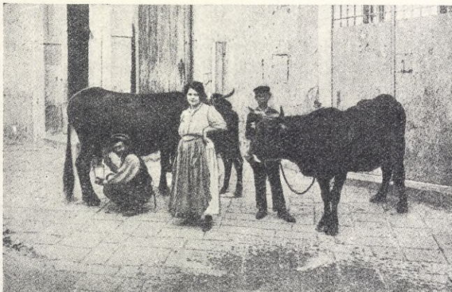
''Mjölkbud'' på småstadsgata (Portici).