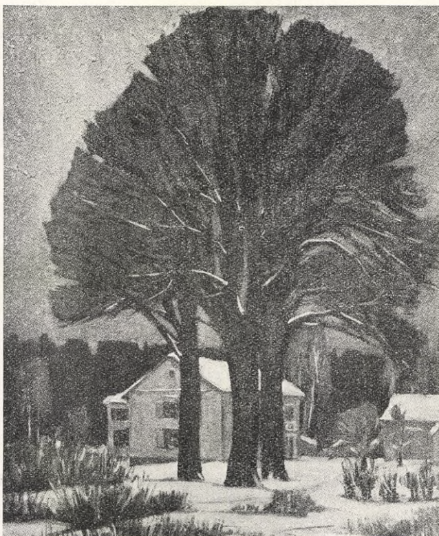
Eugen: GRÖNDAL. FRÖDINGS BOSTAD.

norna behöva lära sig rationellt sköta hushåll, för att icke längre till den grad vara nedgrävda i hushållsgöromål, att de ej få någon tid att skaffa sig insikter om samhörigheten mellan hemmet och samhället och något intresse för framåtskridandet, så skall väl även bland arbetareklassen småningom den idén tränga ige-