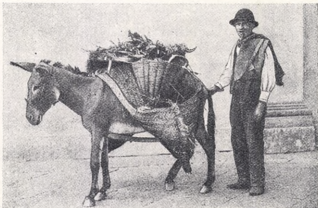
Bonde och åsna.

''Du har väl ingen orsak att klaga! Tänk på alla dem, som ha det tusen gånger sämre än du!''