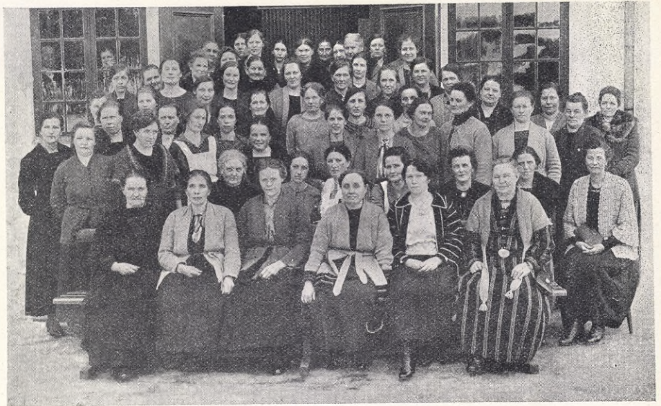
Karlskoga och Degerfors socialdemokratiska kvinnoklubbar.

Efter festen inbjödo Karlskogakamraterna oss till sankväm. Tésupé var anordnad och kommittén hade säkert nedlagt mycket arbete för att vi skulle få så trevligt, som man gärna kan önska sig, varför