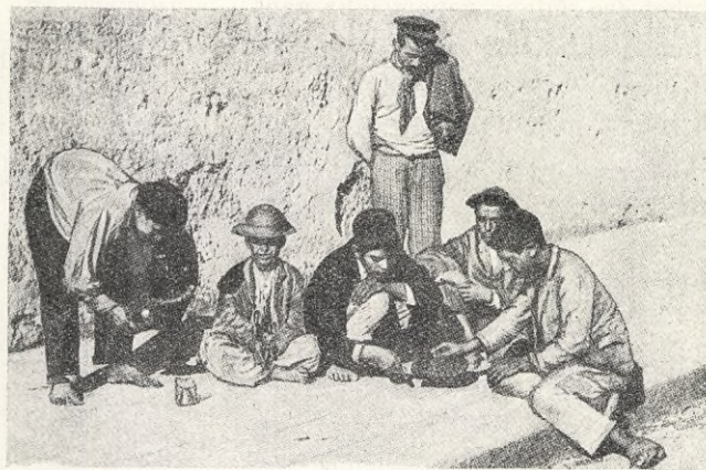
Männen föredraga 'intellektuella' sysselsättningar såsom spel och dobbel.

försköna den fattiga tillvaron. Ett skjul, en håla att krypa in i vid nattens inbrott, ett skydd mot regnet och de möjligen befintliga farliga djuren — det är allt. Så primitivt som hos vilken negerstam som helst.