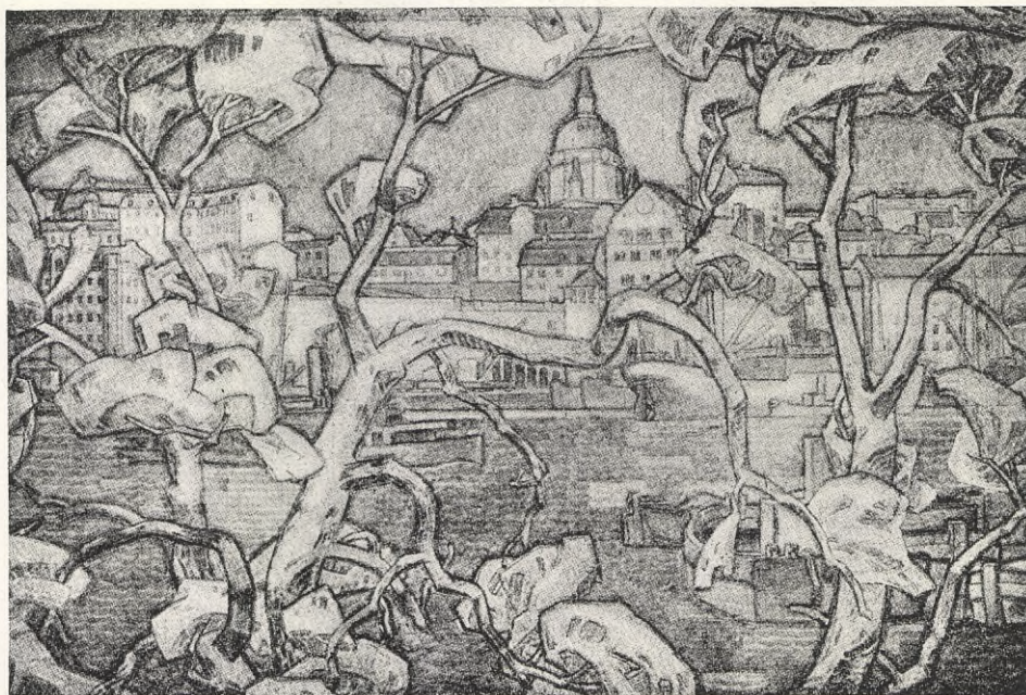
Eugen: KATARINA KYRKA.

Våra kvinnoklubbar äro inte endast till för "valedelsutdelning på valdagen" eller för att en del unga hustrur till socialdemokratiska arbetare skola ha en sällskapsförening eller en plattform, från vilken de kunna göra sig gällande. — Kvinno-