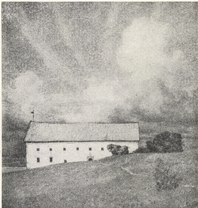
Eugen: DET GAMLA SLOTTET.

huruvida kvinnor skulle tillerkännas rösträtt eller ej inom staterna. Nu vid valet var det ej längre fråga om kvinna eller man utan om lämplig person.