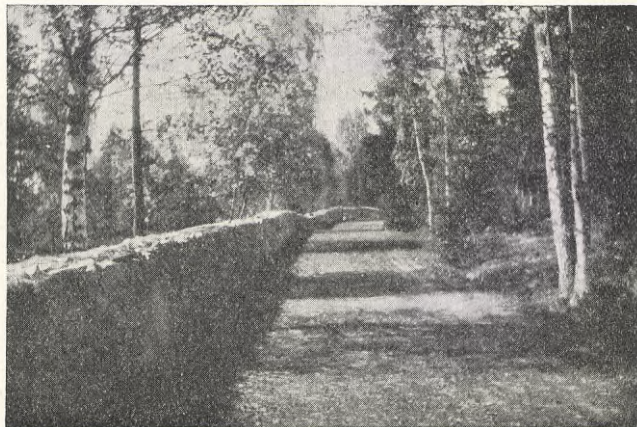
Brunnsvik: Vägen till skolan.