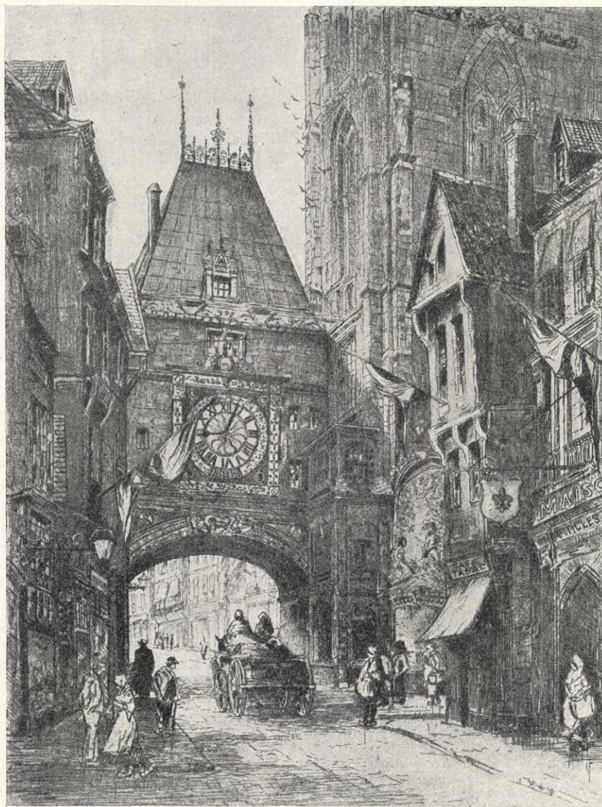
W. Renison: GATUPERSPEKTIV I ROUEN.