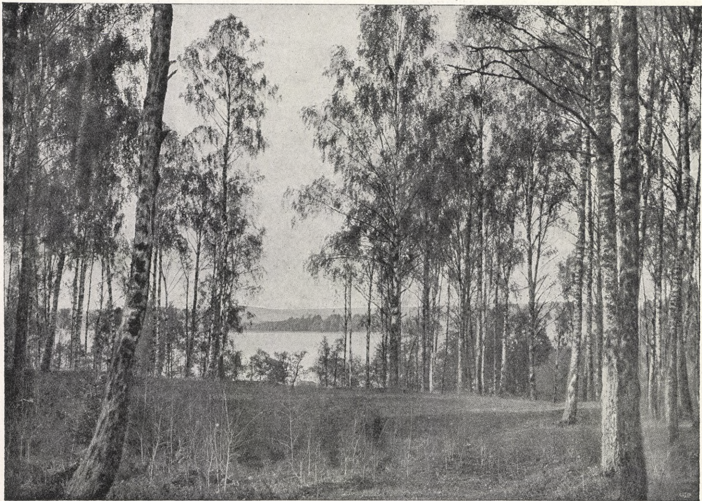
BJÖRKHAGE I SÖDERMANLAND.