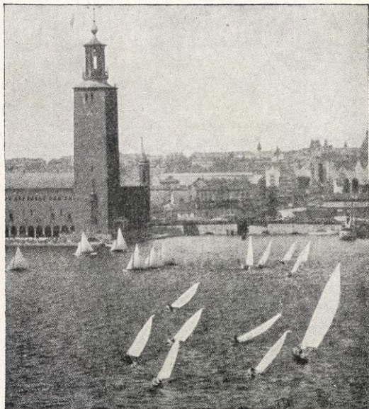
STOCKHOLM: STADSHUSET FRÅN MÅLAREN.