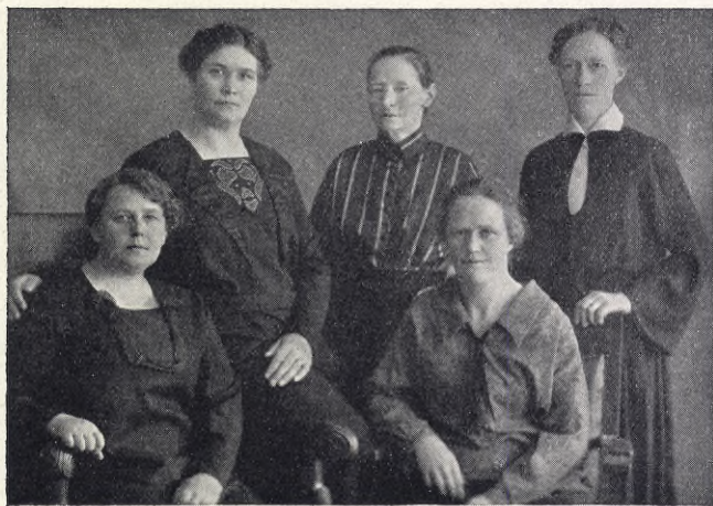
Enköpings kvinnoklubbs styrelse.

Enköpings soc.-dem. kvinnoklubb firade tisdagen den 26 maj sin femåriga tillvaro med en anslående fest, till vilken arbetarekommunens och ungdomsklubbens medlemmar inbjudits.