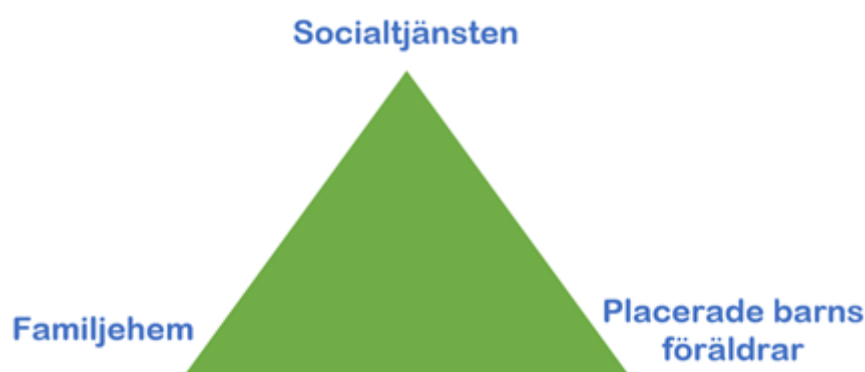
Figur 2. Det tredelade föräldraskapet.

I Sverige finns en lång tradition av att dela ansvar för barn mellan föräldrar och stat, när barn placeras tar dock staten en än större roll och föräldrarna behöver anpassa sig till det som benämns som det tredelade föräldraskapet (Leviner & Lundström 2017, Socialstyrelsen 2015a). Detta begrepp används för att beskriva det gemensamma ansvar som föräldrar, vårdgivare och socialtjänst har för barn som är placerade i den sociala barnvården (Socialstyrelsen 2015a). Föräldrar är generellt sett vårdnadshavare för sina barn oavsett om de är placerade enligt SoL eller LVU. Vid LVU övertar dock socialnämnden beslutanderätten gällande vården medan familjehemmet (vårdgivaren) tar beslut gällande den dagliga omsorgen (Leviner & Lundström 2017). Föräldraskapet upphör således inte när ett barn blir placerat utan det tredelade föräldraskapet skapar i bästa fall en möjlighet för föräldrar att fortsätta vara föräldrar i samverkan med familjehem och socialtjänst (Socialstyrelsen 2015a).