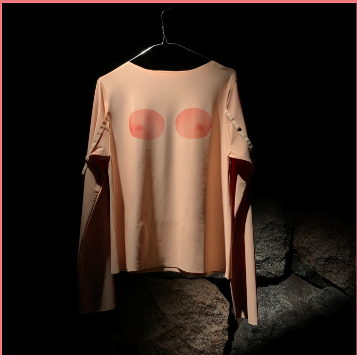
Utan titel (bröst-T-shirt).