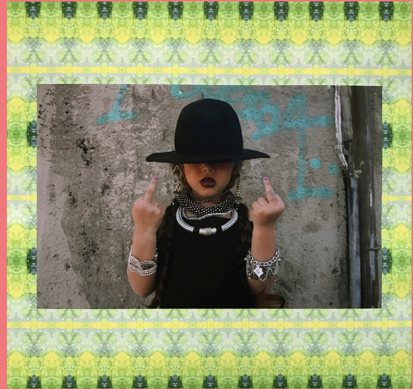
Ur serien Role Models .

I verket Role Models visas ett barn som imiterar sina idoler. Barn använder sig av leken för att utforska och förstå världen. Förebilder används för identifikation, barn lär sig genom att härma. Här kan också rymmas ett behov för dem av att kunna identifiera sig med förebilder som liknar dem själva, ett behov som kan upplevas än starkare för de som känner att de avviker från normen.