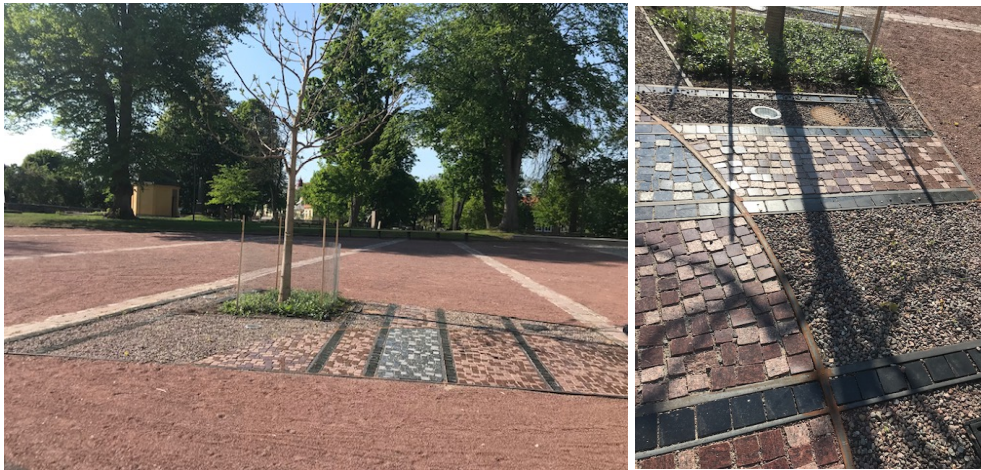
Den utmarkerade platsen för vådrträdet/arboret och sittbänkens anslutning och möte med Den gamla begravningsplatsen och i förlängningen den rekonstruerade kyrkogårdsmuren.