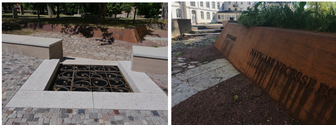
Stigluckans smidda galler och inskription i cortenstål (på två sidor, se nedan) på den utmarkerade grunden till S:t Nicolai kyrka, båda av Päivi Ernkvist.