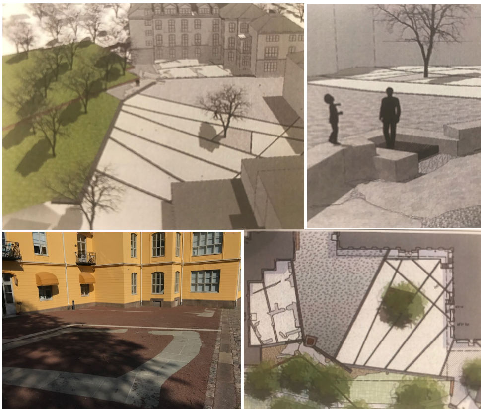
Plan över platsen i perspektiv och uppifrån, kalksten markerar ut medeltida husgrunder i marken.

Den kontakt från Kalmar kommun som visar mig runt på platsen förklarar att Kvarteret Valnötsträdet är ett massivt och ganska komplext material att sätta sig in i och att det varit svårt att omfamna alla de överväganden och intentioner som format platsen. I nuläget saknas den tvärsektoriella samverkan som präglat utvecklingsprocessen, människor byts ut och minnet är kort. Ansvaret ligger åter uppdelat på å ena sidan stadsbyggnadskontoret och å andra sidan gatukontor och parkförvaltning. Initiativet för att involvera och aktivera platsen och de historiska värden som tagits tillvara utifrån ett medborgerligt brukarperspektiv "faller lite mellan stolarna just nu" , menar hon. Hos Kultur och fritidsförvaltningen finns en del idéer liksom hos Destination Kalmar. Men ingen äger frågan och både kunskap och resurser verkar saknas för att implementera en samordnad och genomtänkt strategi: "Det är en komplex uppgift som ligger lite utanför boxen av det vardagliga arbetet inom kommunen. Det skulle behövas något av en eldsjäl som tar tag i och driver på utvecklingen av de möjligheter som platsen rymmer idag."