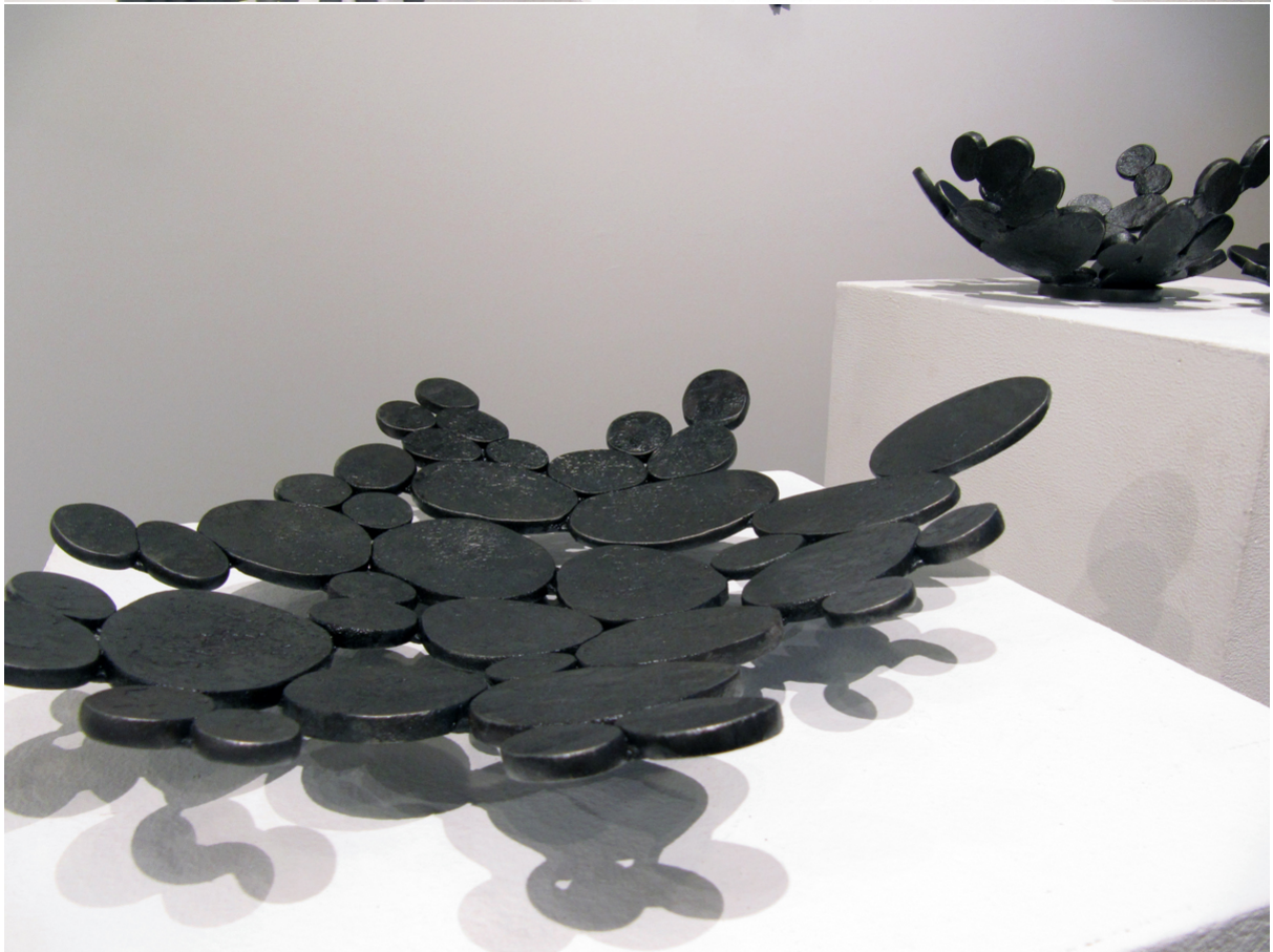
Foton "Bära vatten"