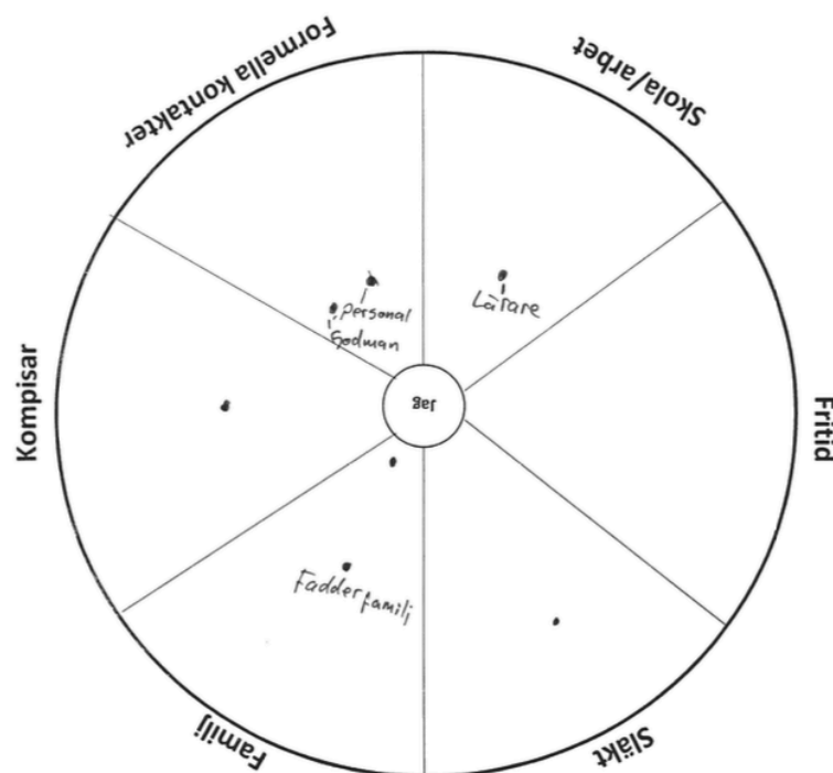
Figur 1. Exempel på en ifylld nätverkskarta från en av intervjuerna. Prickarna i cirkeln motsvarar de personer som är viktiga för intervjupersonen.

I stycke 5.2 beskrevs min tanke med användandet av en nätverkskarta som stöd i intervjusituationen. Metoden visade sig överflödigt då ungdomarnas nätverk var betydligt mindre än jag hade förväntat mig. I de flesta fall var deras nätverk inte större än att de inkluderade en handfull personer, se figur 1.