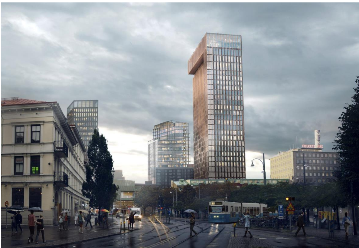
Visionsbild för Järntorget sett från Linnégatan (Adore Adore, Architectural Visualization)

Norra Masthugget och Masthuggskajen planeras i framtiden utgöra en ny stadsdel med hög täthet vars karaktär och intensitet kan utgå från tre stråk. Staden vill skapa ett sammanhängande centrumområde där Göteborg bland annat ska erbjuda ett rikt kulturliv för såväl invånare som tillresta gäster. Syftet med omvandlingen, beskriver staden, är att stadsdelen ytterligare ska bidra till stadens rumsliga och sociala integration. Förslaget innebär att området för den nya detaljplanen planeras att förtätas med cirka 1200 lägenheter samt tillkommande handel, kontor och annan centrumverksamhet samt parker. Den nya detaljplanen för området godkändes av byggnadsnämnden 6 februari 2018, antogs av kommunfullmäktige 7 juni 2018 och vann laga kraft 1 mars 2019 (Göteborgs stad u.å). Den fördjupade översiktsplanen för Göteborgs centrum är i skrivande stund under samråd (Göteborg stad u.å). 4