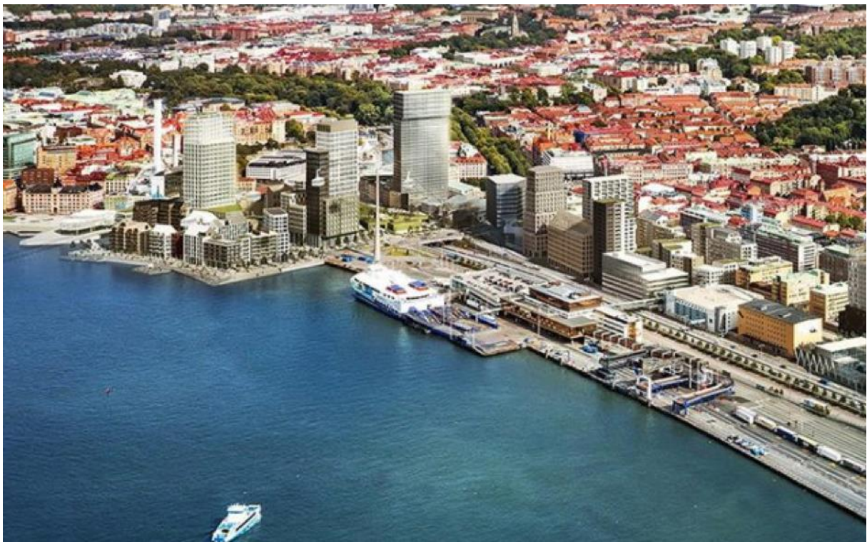
Visionsbild över Masthuggskajen. Illustration: Kanozi Arkitekter