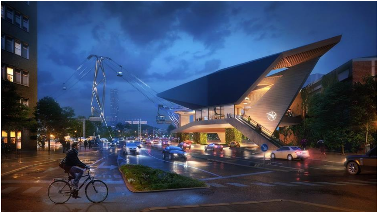
Visionbild över stadslinbana. Illustration: Adore Adore / Erséus Arkitekter