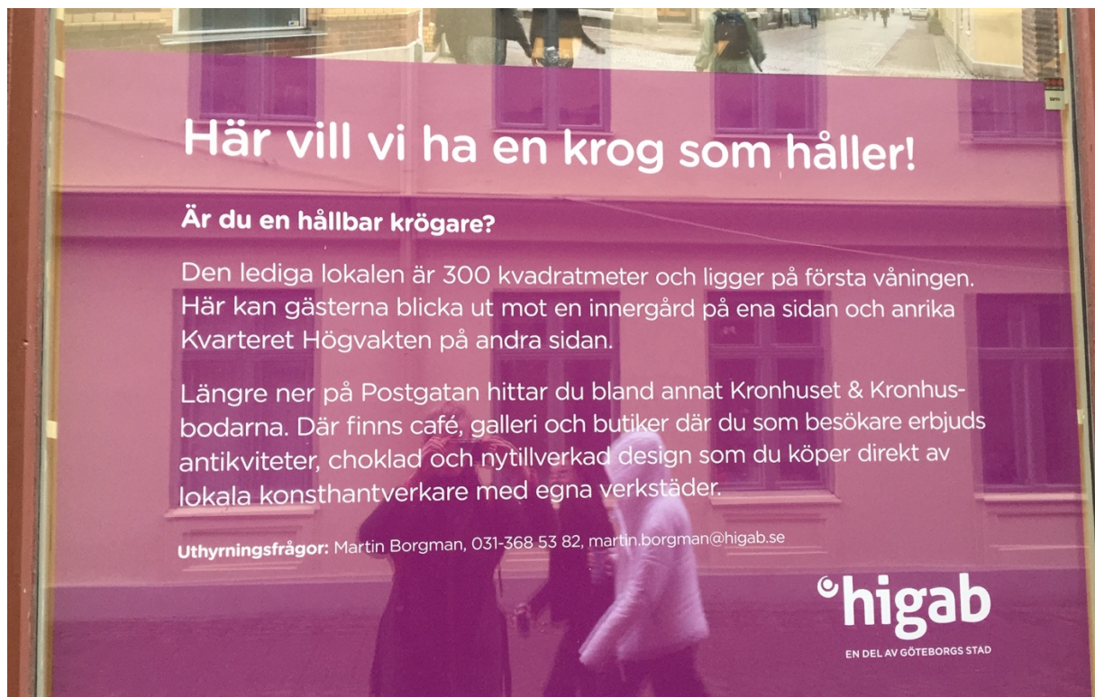
Figur 2: Reklamaffisch från Göteborgs kommunala fastighetsbolag Higab. Foto: privat, 19-02-19.

Affischen får utgöra ett talande exempel på hur Higab är igång med att omvandla Kronhusområdet i Västra Nordstan till ett område med ”hållbarhetstänk” vilket ska kontrasteras och kompletteras mot grannen Östra Nordstan där köpcentrumet Femmanhuset ligger (higab.se, Västra Nordstan Revival, 19-06-10). ”Från slit och släng” (informant, Higab) till hållbara verksamheter. Som affischen ovan gör gällande blir caféer, gallerier och ”lokala konsthantverkare med egna verkstäder” något som beskriver platsens värde, både för själva området men också för Higabs framtida kunder. På så sätt kan affischen förstås som ett slags ”materiell manifestation” (jmf Thörn & Holgersson, 2014:180) för områdets omvandling. Den blir både bokstavligt och bildligt talat ett skyltfönster för Göteborgs hållbara stadsutveckling. Flera internationella studier pekar dock på hur en retorik om hållbarhet och miljövänlig livsstil riskerar bidra till vad man kallar ”ekologisk gentrifiering” som resulterar i att låginkomsttagare trängs bort från området (ibid). Detta är viktigt att komma ihåg för när uppsatsens sista empiriska kapitel analyseras.