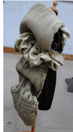
Bild 12 Skiss på liten docka

Jag förhåller mig väldigt fritt till mina skisser och har svårt att överföra direkt från papper till material. Skissen på papperet pekar ut en riktning. Genom att skissa direkt i materialet får jag lättare kontakt med det jag gör och lättare att jobba vidare. Jag vill att mötet med materialet ska leda mig.