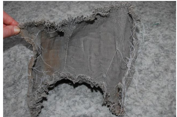
Bild 26 Smock, forma