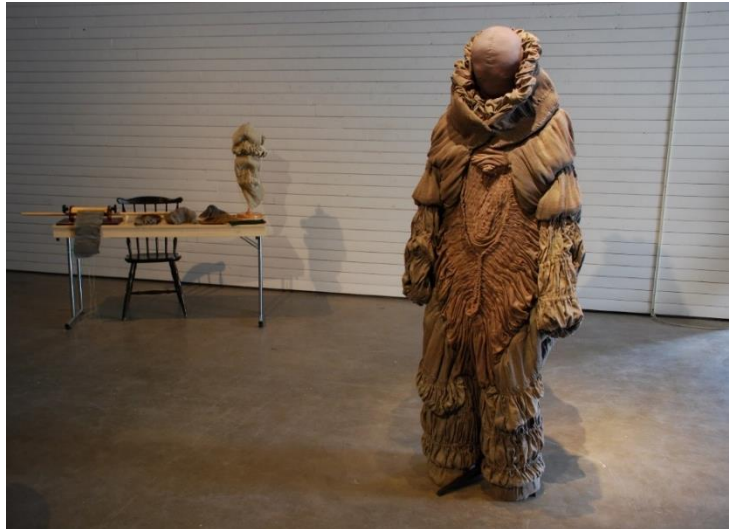
Bild 28 Foto från examinationen

När examinationerna närmade sig funderade jag över hur jag kunde