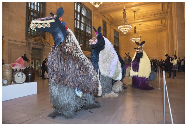
Bild 3 Heard - New York, 2013. Nick Cave

Jag har också i tidigare projekt arbetat med att omforma kroppen. För mig handlar det om att ge utrymme för att värdera om, kunna se bortom kroppens begränsningar och våra fördomar om dem. Det har kunnat handla om vad som är motbjudande och tilltalande, feminint och maskulint.