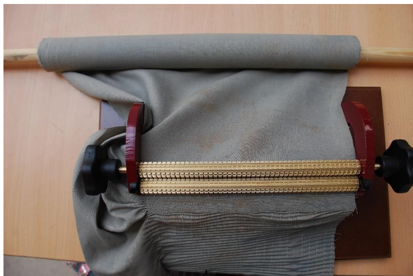
Bild 7 smockmaskin med linnetyg

Jag undersöker form genom att skissa direkt i materialet. Processen är undersökande, jag frågar mitt material vad det är för varelse jag gestaltar. Jag vill testa min varelse i olika miljöer med hjälp av foto och film.