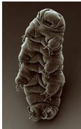
Bild 14 Björndjur

I sökandet av vad det var för varelse jag ville gestalta tog jag fram inspirationsbilder. Det var främst på kvalster, djuphavsdjur och björndjur. Jag har försökt översätta mina inspirationsbilder genom att skissa av dem för att se vad det var jag såg. Där fanns former och veck som talade med mitt material. När jag samlade bilderna såg jag fosterställningen jag arbetat med i tidigare projekt. Jag sökte definiera vad det var med den, sökte ord jag kunde jobba med skulpturalt. Jag skrev ner liksidig, organisk, kraftfull och ömklig. Det gav mig inte mycket, men det avgränsade mig något.