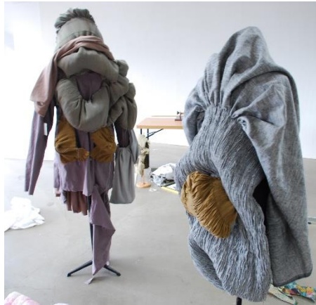
Bild 11 Skiss på stora dockor

I den här rapporten skiljer jag tre delar åt, men riktigt så åtskilda har de inte varit under projektets gång. Jag började redan med mina provbitar testa forma på små modedockor och gjorde några enkla skisser på papper.