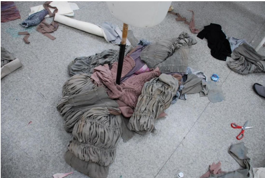
Bild 20 Process, kroppen på golvet

Det skulpturala sökandet började leda fram till varelsen och jag flyttade jag mitt fokus till den och vad den hade för funktion. Jag hade spenderat mycket tid med varelsen och teoretiserat kring vad det var jag ville att den skulle uttrycka. Nu kände jag istället med den och frågade mig vad det var den uttryckte.