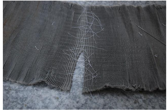
Bild 25 Smock, klippa

Vecken rymmer en oändlig värld men har ändå fungerat som en avgränsning för teknik och materialval.