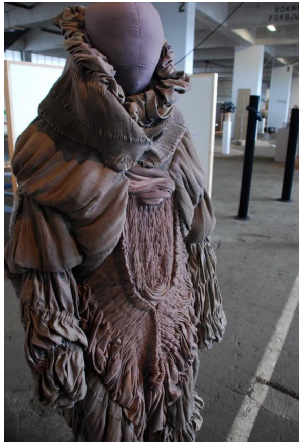
Bild 29 Utställning i Frihamnen Göteborg

I första hand var det jag som skulle göra ett performance. När jag antog varelsens hamn var det ett frivilligt val. I mytologins värld är det ibland frivilligt och ibland vaknar du i en annan hamn och kan kanske inte ta dig tillbaka. Hur blir det om någon annan iklär sig varelsens skinn, eller om jag klär någon annan?