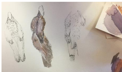
Bild 13 Skiss

Till en början skissade jag på små modedockor, men när jag bestämt mig för vilka material jag ville använda övergick jag till fullstora dockor. En utav mina skisser på docka har följt med mig under hela projektet som en förlaga för former och uttryck jag sökt. Eftersom det är samma mått på bitarna och samma material som jag använder i kostymen kan jag dock inte direkt översätta skissen till en större skala, den fick likt mina tecknade skisser peka ut en riktning.