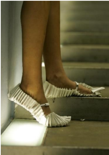
"Pleat Soles" Deepa Panchamia. 2005 - Leather and Silk Organza. Pleating, stitching and cutwork

Deepa Panchamia's philosophy is to challenge the conventional perspectives of textiles. Through a repetitive and intricate process of folding, pleating, cutting, layering and stitching, her aim is to discover new ways to manipulate fabric and create engaging architectural formations. (Panchamia, 2018)