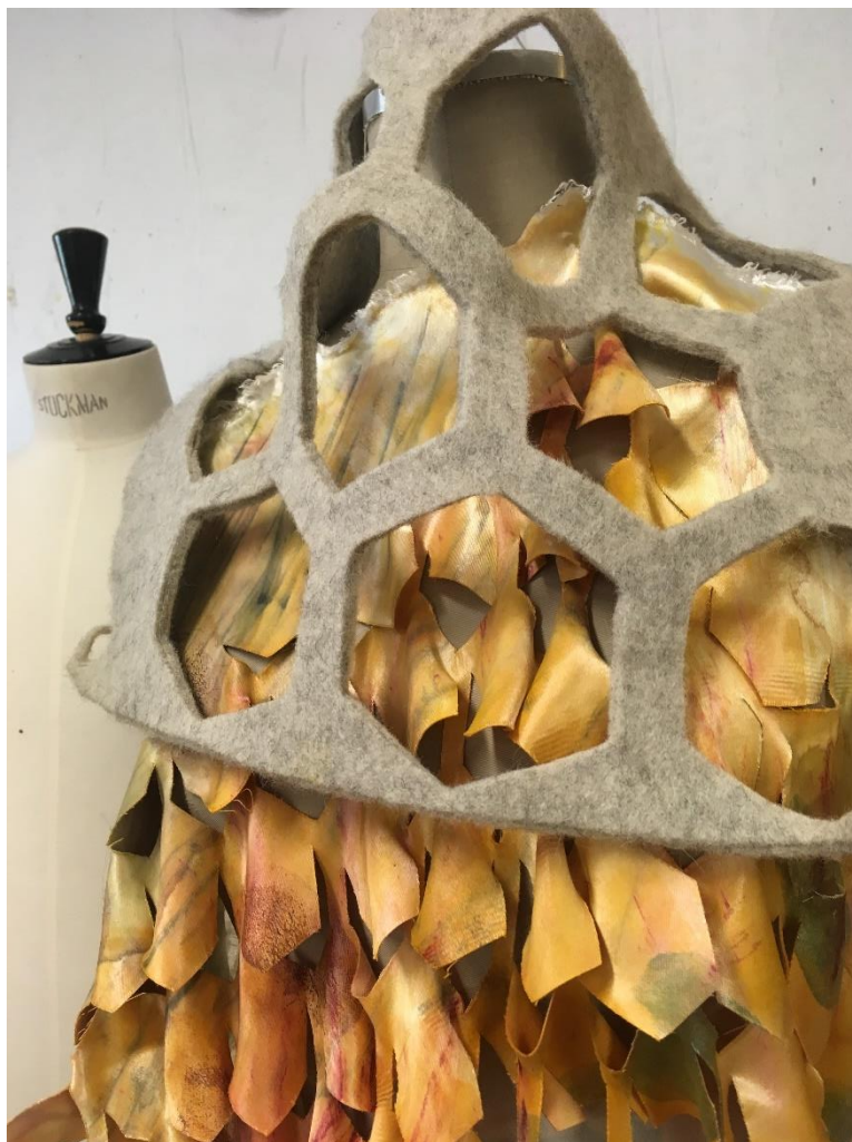
Den "andra" gestalten som fanns med en bit på vägen. Uppskalad material i "naturlig" storlek.

"Kill your darlings" är några av de svåra beslut jag måste ta, när något intressant måste väljas bort - tänkte jag i början a processen, men under vägen, med hjälp av handledning blev det tydligare att jag inte väljer bort eller rensar ut förslag eller materialundersökningar. Jag valde att arbeta vidare med något. Det andra valdes inte bort.