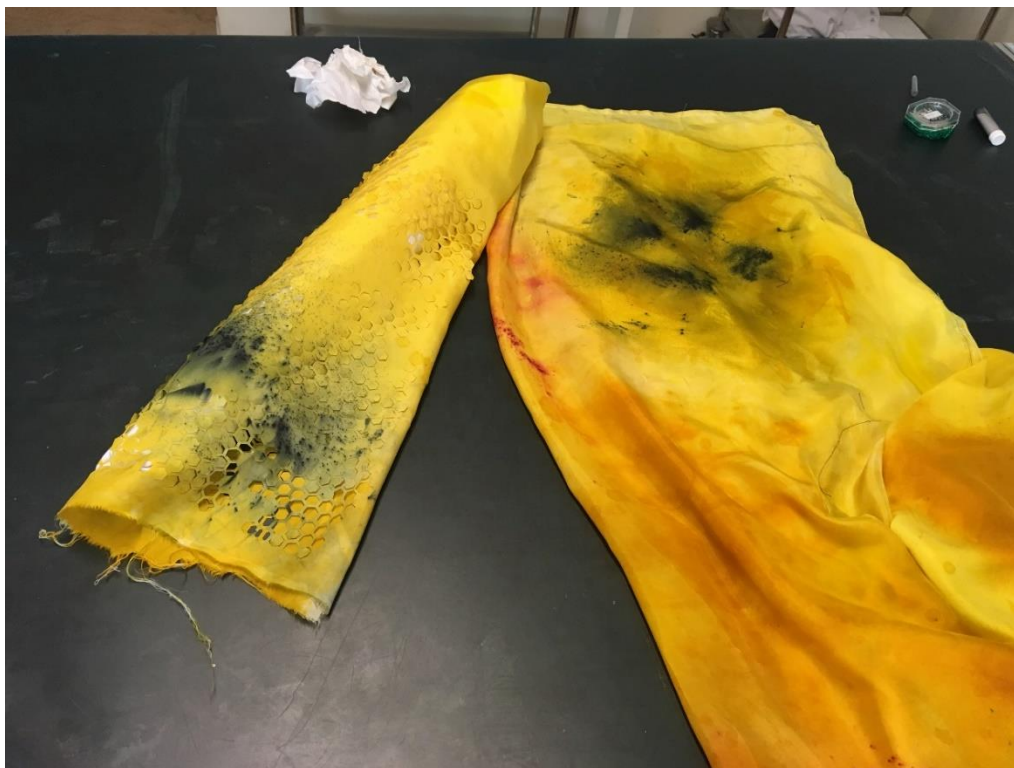
Utläggning av mönsterdelar för att få en överblick hur mönstret ser ut, och planera var jag vill ha nästa mönsterparti.