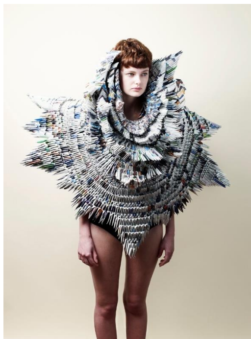
"WWF Sculpture", Rowan Mersh, 2012