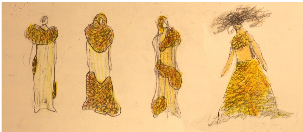
Skiss i litet format på formationer med "sidenremсор" på kropp (ca 5 cm höga skisser)

Jag startade hela arbetet med att fortsatte med mina tidigare undersökningar, och använde hexagonens sexkantiga form genom att sy samman sidenremсор till en textur. Jag tyckte mycket om den taktila känslan som texturen utstrålade och att jag kunde skapa volym med dom.