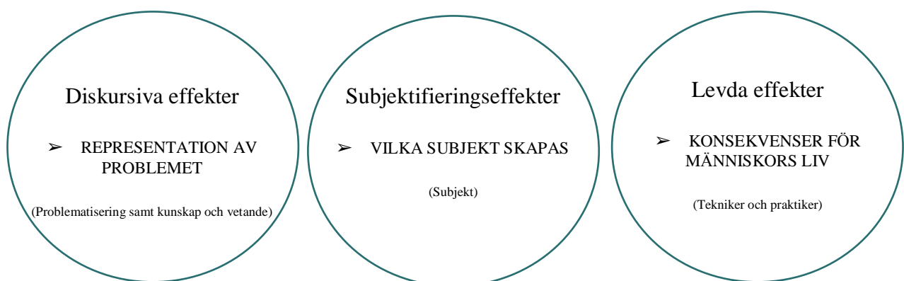
FIGUR 1. GESTALTNING AV WPR-METODENS DISKURSIVA EFFEKTER, SUBJEKTIFIERINGS EFFEKTER OCH LEVDA EFFEKTER. (Egen gestaltning inspirerad av Bacchi & Eveline, 2010)

What´s the problem represented to be -metoden (hädanefter WPR-metoden) av Carol Bacchi (2009) bygger som tidigare nämnts på Foucaults idéer om governmentalitet. Utgångspunkten för teorin är att det inte finns ett absolut sätt att förklara problem i samhället på, istället hävdas, likt Foucault, att det kan finnas olika problematiseringar vilket får olika konsekvenser för subjektskapandet och lösningsförslagen som läggs fram (Boréus & Bergström, 2018:271–2). Metoden granskar således representationen av problem, aktörer och maktrelationer för att se vilka perspektiv som framförs och vilka som exkluderas (Esaiasson, 2017:218). Ursprungligen utformades WPR-metoden inom feministisk teori för att granska konventionella genusperspektiv inom policys men teorin är ett användbart redskap även inom andra policyanalyser (Boréus & Bergström, 2018:271–2). Fokus för metoden är att granska hur policys skapar eller formar representationen av olika problem för att synliggöra vad som bygger en problembild och vem som ses som ett problem (Bacchi & Eveline, 2010:112). I detta definierar författarna tre effekter som representationen resulterar i (115);