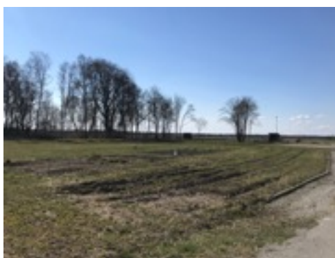
Bild 1. Vy över odlingslotterna på Kvarngatan, redskapsboden syns i bakgrunden.