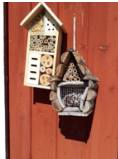
Bild 3. Insekthotell uppsatta på redskapsboden.

närmast intill. Kommunen har ordnat med en redskapsbod och dragit fram vatten. Odlingslotterna utgörs av en bit plöjd mark i utkanten av en större gräsmatta. Ingen avgränsning eller skylt som informerar om vad för slags verksamhet som bedrivs på platsen eller vem som ska kontaktas om intresse för att börja odla finns. Samma dag som den passiva observationen genomfördes gjordes även en aktiv observation där odlarna visade runt och berättade om platsen. Odlarna visade vad de hade sått, hur de hade organiserat sina lotter, vad de skulle sätta i år och hur hård jorden var. De pekade på den intilliggande dungen och berättade om dess betydelse, dels för utsikten men även för känslan av att vara i naturen. De visade ett insekshotell de satt upp på redskapsboden, bord och stolar de tagit dit samt hur de organiserat inne i boden. I skydd från den kalla vinden ställde vi oss i solen och en av odlarna vände sig leende mot solen och uttryckte att ” här har vi det gott ”.