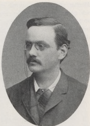
Knut Wicksell vid tiden för föreningen i Paris.