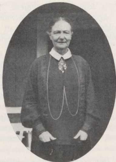
65 år. (Sista porträttet.)