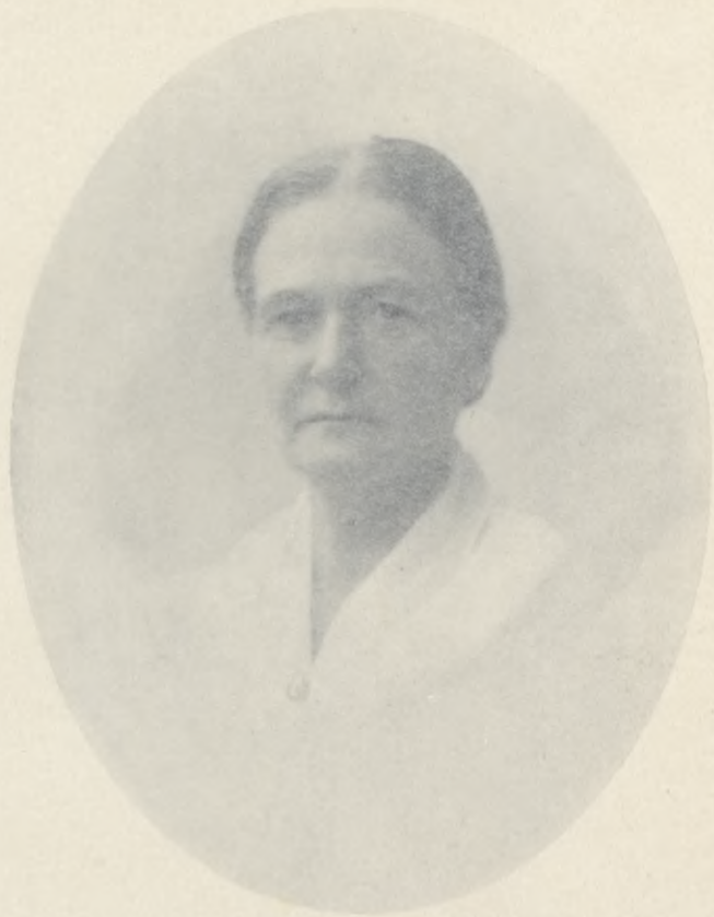
Anna Bugge Wicksell.