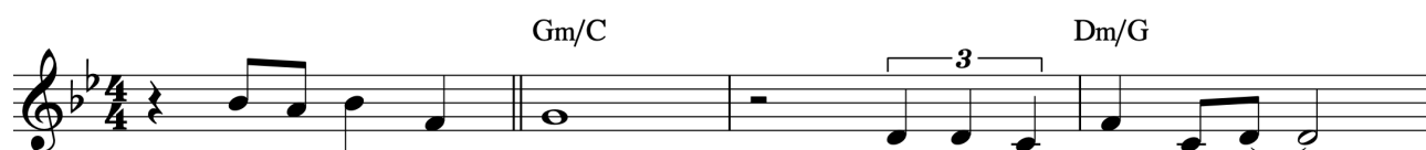
Exempel 6. Upptakt till och första fras i den kontrasterande delen i Tonkomposition 2

När den nya delen av kompositionen, som jag tycker känns som en refräng, var klar avslutade jag den med att utveckla den enkla ackordsrytmen som blev starten för hela kompositionen. Genom att förlänga den stegvisa rörelsen av ackord på synkoper fick jag fram ännu en pusselbit att använda i kompositionen och den fick sedan fungera som både instrumentalt mellanspel och solobakgrund (se ex 7).