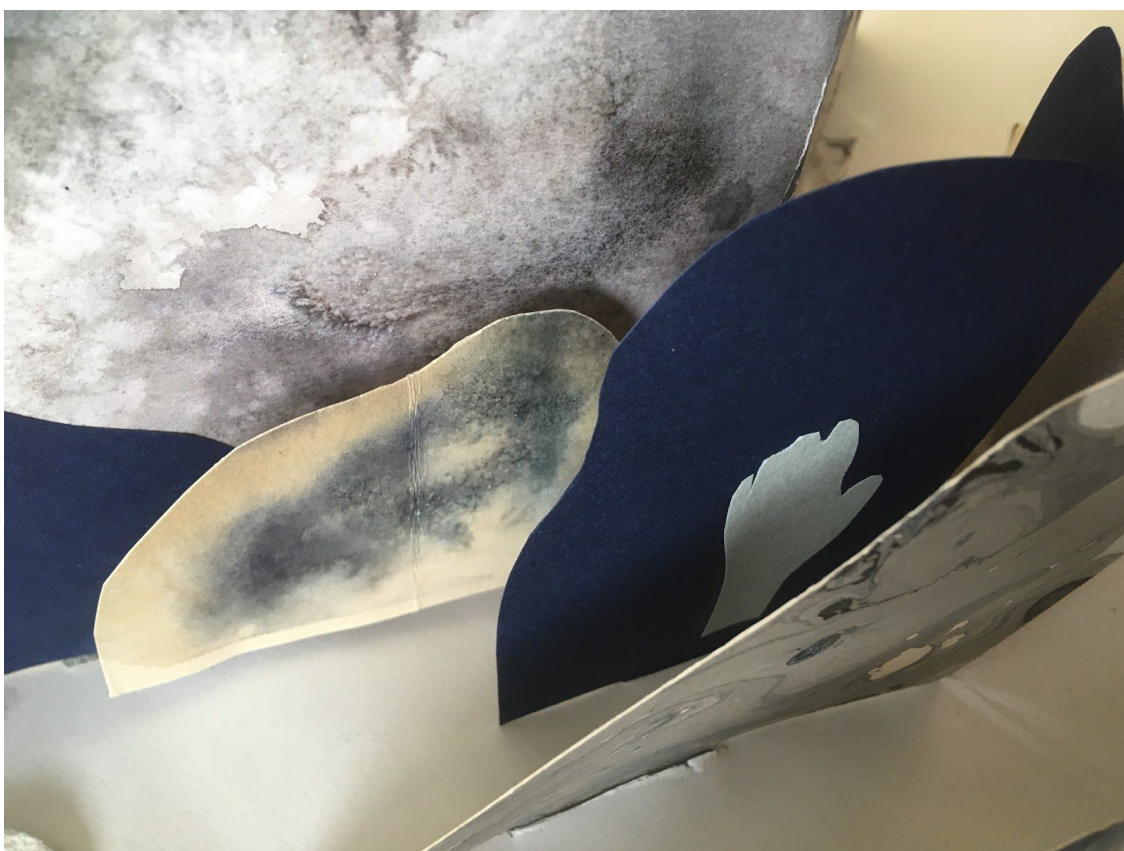
Bilaga 6: Närbild