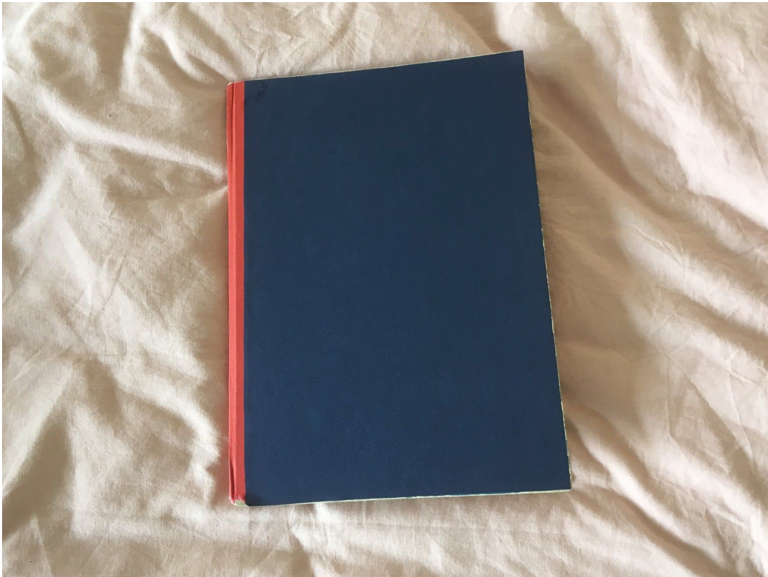
Bilaga 2: omslag, pop-up-boken