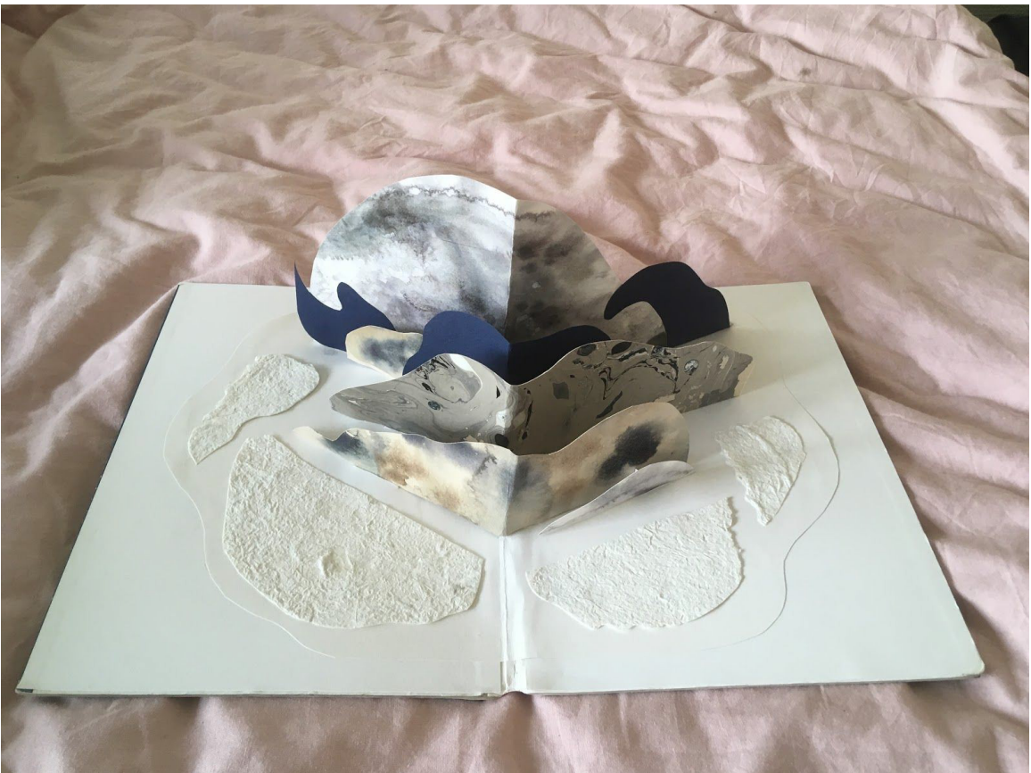
Bilaga 4: Öppnad