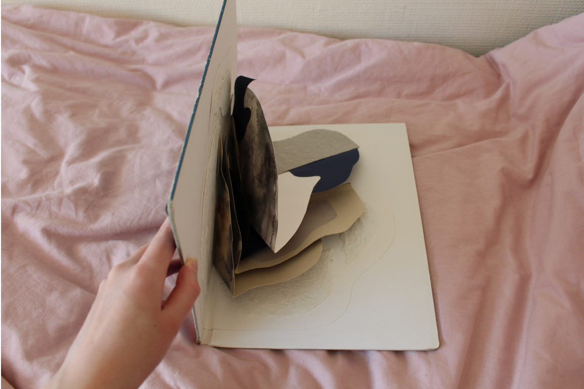
Bilaga 3: Boken öppnas