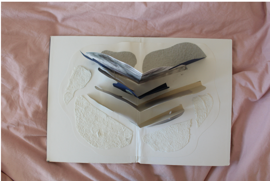
Bilaga 5: Öppnad, vinkel