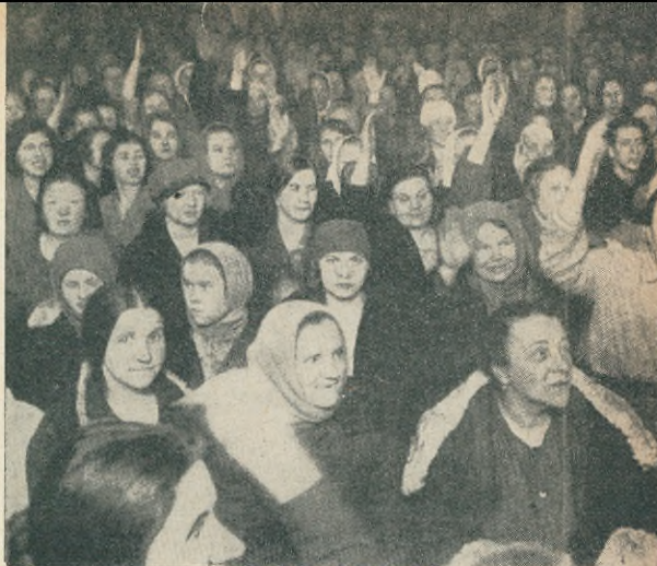
Ett meeting av husmödrar i Moskva.

Behandlar Reumatiska åkommor, Gikt, Ischias och Nervåkommor, Massage, Bad och Sjukgymnastik. Även hembesökningar.