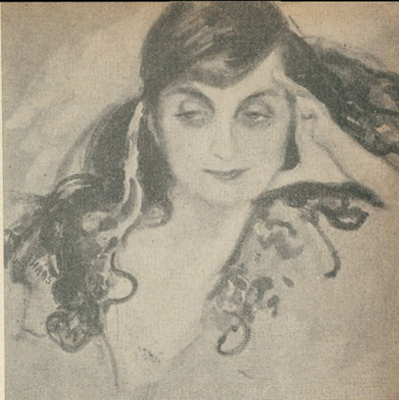
Skaldinnan målad av Haas-Teichen.

Frankrike var hennes fädernesland, ehuru hennes fader var en rumänsk furste av grekisk-katolsk tros-