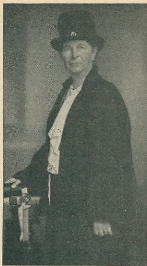
Med. dr Karolina Widerström.