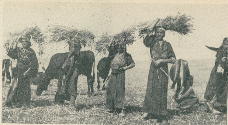
Kvinnor på skördearbete.