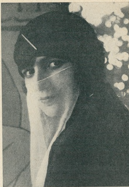
En modern egyptiska.

Innan den österländska kvinnan anlägger slöjan — vilket i regel sker vid 13 eller 14 års ålder — får hon