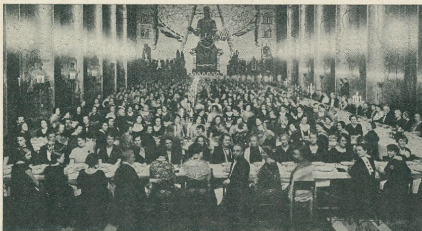
Från festbanketten i Gyllene salen.