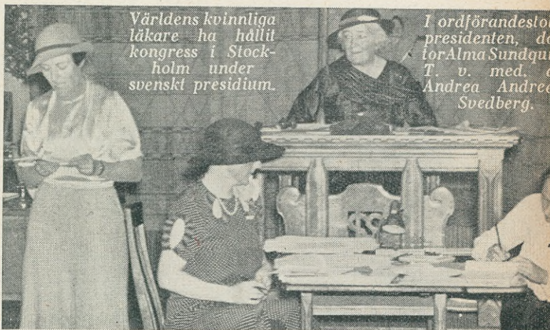
Världens kvinnliga läkare ha hållit kongress i Stockholm under svenskt presidium.